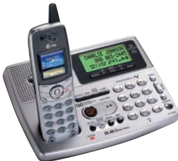
5,800兆赫無繩電話錄音系統