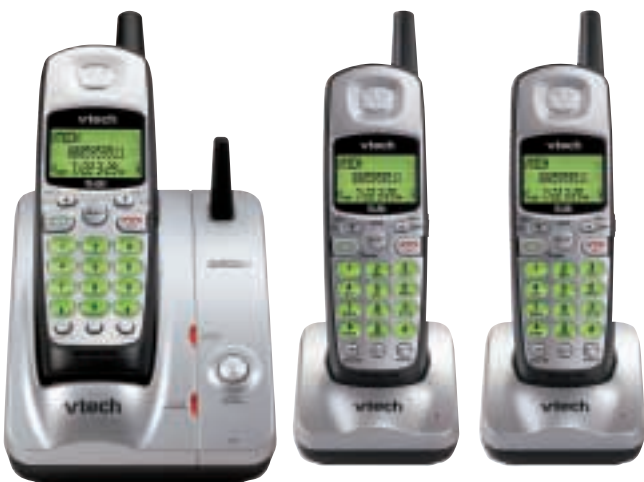
5,800兆赫模擬制式無繩電話

雖然V.Smile自推出以來備受外界注目，但集團亦致力強化傳統電子學習產品，而這些產品仍為電子學習產品業務重要的收入來源。由於電子教育玩具仍是美國玩具市場中持續增長的類別，偉易達的傳統電子學習產品讓集團得以憑藉在產品設計及技術應用的優勢，進一步增加收入及提升其市場佔有率。