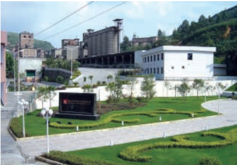
中國西部大開發帶動大量投資於基建，使優質水泥需求強勁

水泥短缺的情況。本年度，由於市場需求殷切，合營企業得以集中供應優質水泥而提高價格。