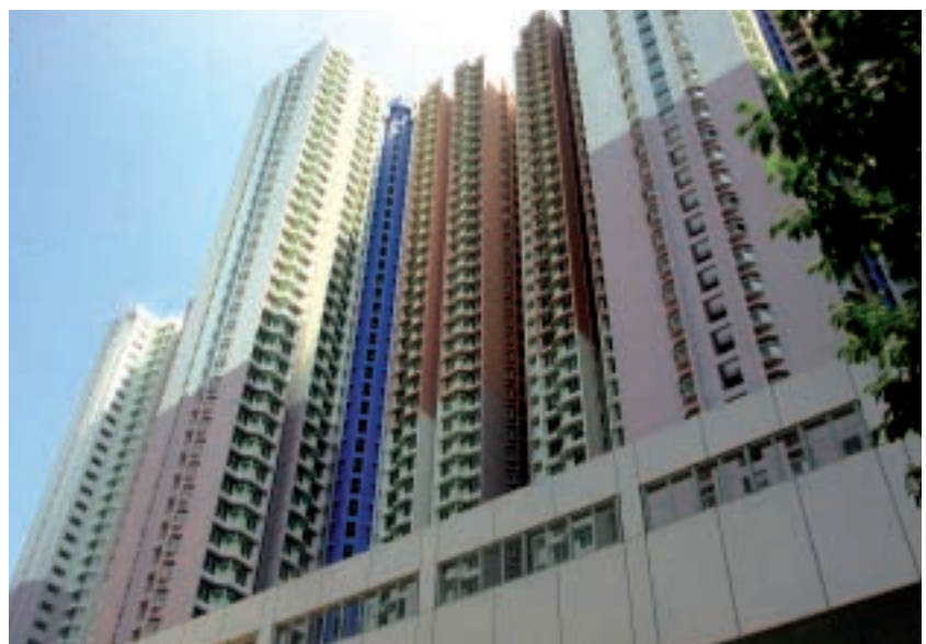
本年度瑞安承建完成的工程項目包括房委會的主要工程—石排灣第一期工程