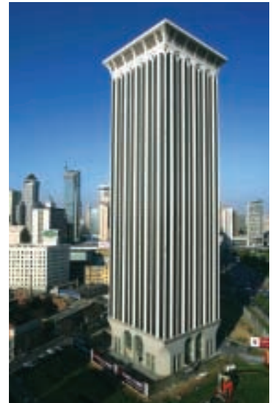
瑞安建業與摩根大通牽頭的財團於二零零五年九月收購大連市的希望大廈，成為集團涉足停建房產發展業務的首項投資

集 團在中國內地市場持續進行的業務擴展 集 與多元化，在本年度取得重大的策略性 進展。