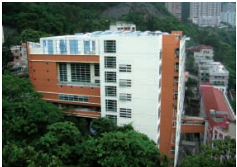
瑞安建築在2005年取得一份瑪利曼小學建築工程合約，價值港幣九千二百萬元

香港建築市場的工程總值在二零零六至零七年度，應能維持穩定，但預期建築署批出的工程量將增大，包括多份設計與施工建築合約。二零零六年三月三十一日後，集團已取得下列建築工程合約：香港島一間新私立小學的建築合約，價值港幣二億二千六百