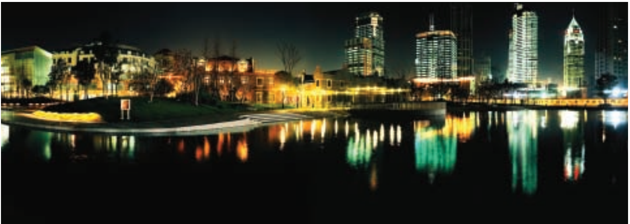
國際知名的歷史重建區「上海新天地」是極受歡迎的上海地標