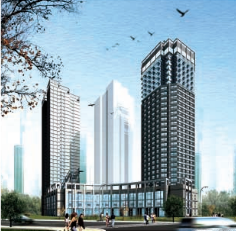
瑞安建業牽頭的一個財團於二零零六年二月收購青島中成大廈第3期A、C座