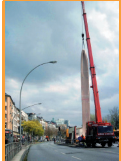
其士的管道修復工程遍佈全球，圖為於德國漢堡進行的工程

除了其士管道科技本身的業務外，預計集團最近收購的Kanal-Muller-Gruppe GmbH（「KMG」）亦將成為其士管道科技在歐洲發展的主要動力。KMG在歐洲擁有五十年管道維修及翻新的成功經驗，是區內以管道翻新污水管