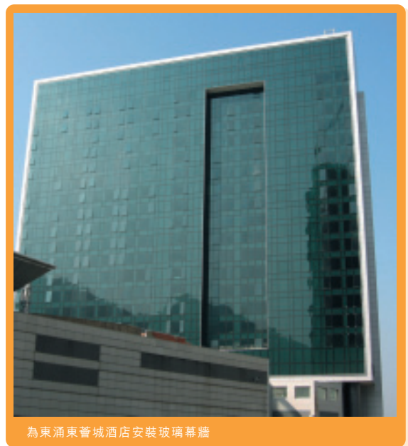
為東涌東薈城酒店安裝玻璃幕牆