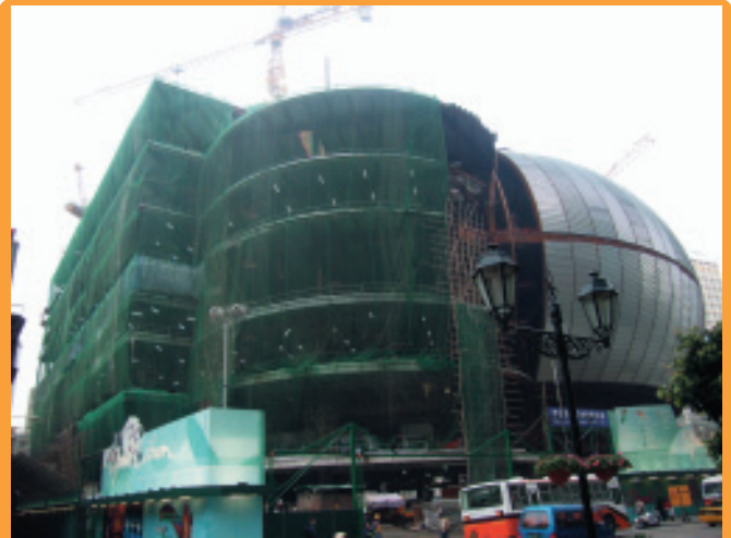
為澳門正在興建中的「新葡京酒店」進行安裝採暖、通風和空調系統