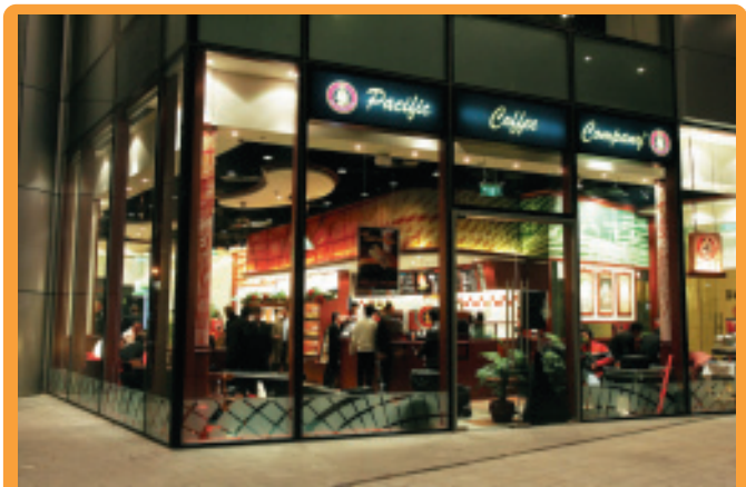
Pacific Coffee於年內開始拓展中國市場

展國內市場。於二零零五年五月收購前，Pacific Coffee共有44間分店。現時，Pacific Coffee共經營57間咖啡店，分別在香港經營44間、新加坡8間、上海3間及北京2間，並計劃於今年年底前擴展其業務至澳門。鑑於區內的休閒飲食業務具龐大的發展潛力，本集團將擴充該業務，增設Pacific Coffee分店，務求達致規模經濟效益及擴闊收入來源。