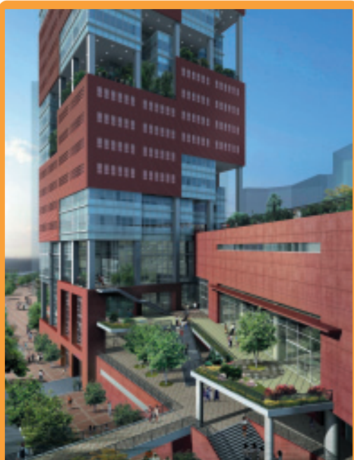
其士獲得香港理工大學批出的合約，負責興建「香港專上學院」教學大樓