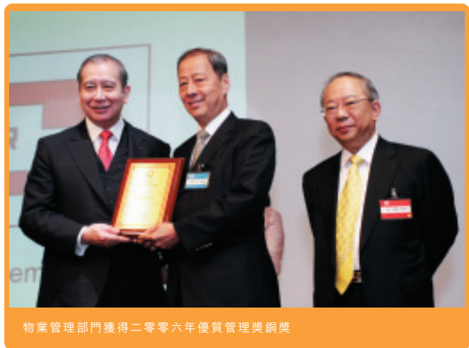
物業管理部門獲得二零零六年優質管理獎銅獎

物業管理部門在香港為總樓面面積超過200萬平方米的工商大廈、住宅屋苑、商場、停車場及其他公共設施等提供管理服務。該部門最近獲得香港管理專業協會頒發二零零六年優質管理獎銅獎，彰顯其優質物業管理服務。除了香港的物業管理業務外，該部門亦於中國多個城市獲發許可證，並取得上海及成都多個豪華住宅大