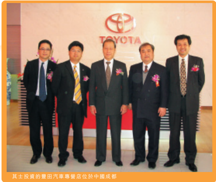
其士投資的豐田汽車專營店位於中國成都

汽車及食品貿易業務方面，加拿大的 Action Honda及Chevalier Chrysler出售一系列最新款的汽車，並為客戶提供專業售後及維修服務。Action Honda與加拿大其他211間本田代理商角逐2006本田優異代理獎，最後成為65間獲得該項殊榮的代理商之一。隨著中國內地市民的生活水平及收入不斷提高，本集團已於二零零六年一月在成都設立汽車代理合資公司，分別經營兩間豐田及日產汽車品牌的專營店，把握中國市場的潛在商機。