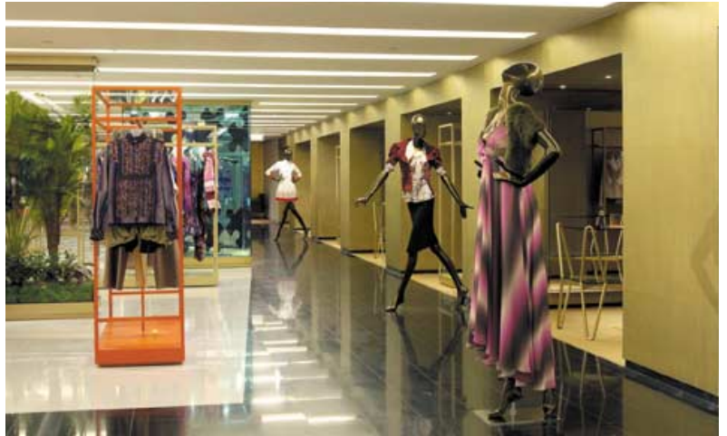
Third Floor, womenswear department. 三樓女裝部。