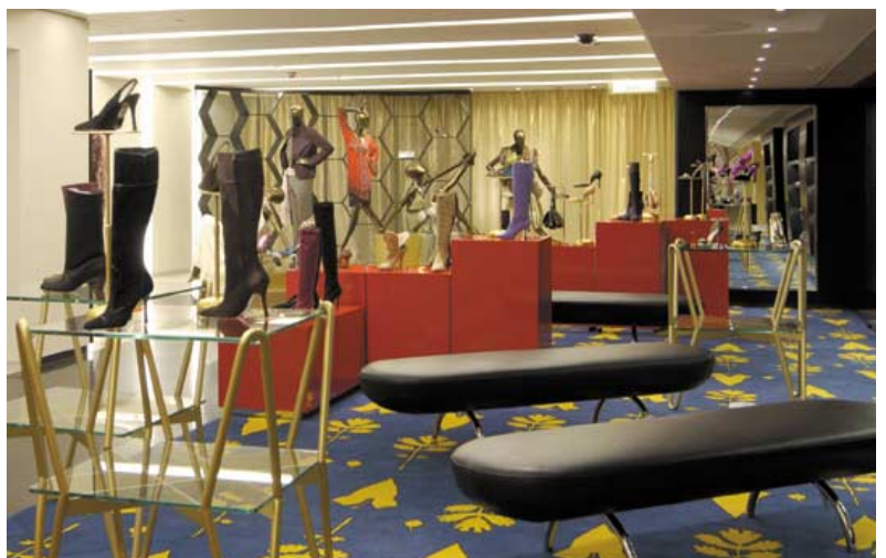
Third Floor, women's shoes department. 三樓女士皮鞋部。