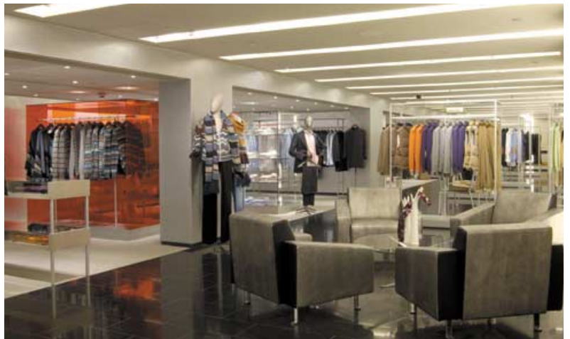
Menswear department on Fourth Floor. 位於四樓的男裝部。