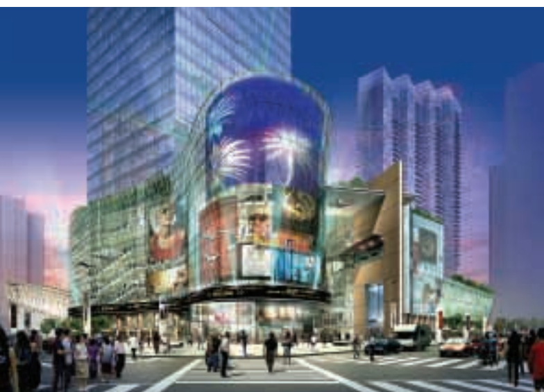
位於淮海中路的项目地處浦西最繁忙的商業區，並將成為三條地鐵支線的交通樞紐，將吸引大量人流。