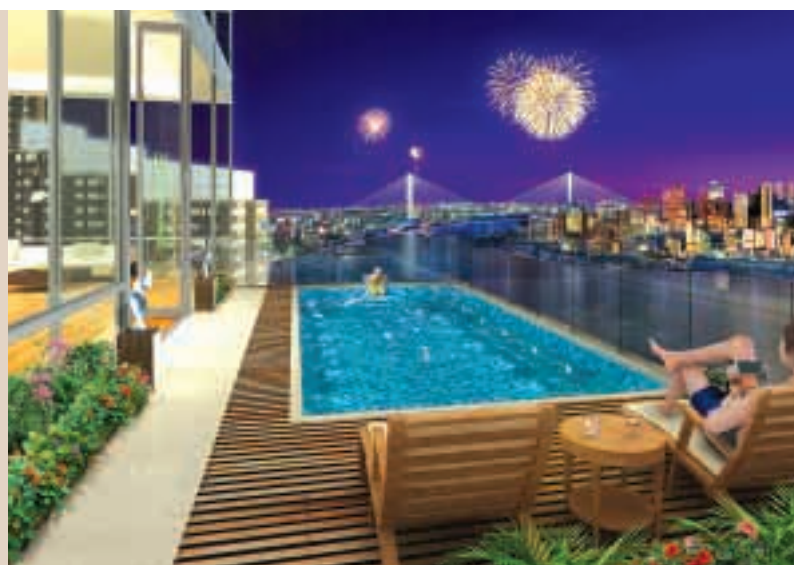
在浦東灘坊的世界級豪宅，可飽覽黃浦江璀璨景色。