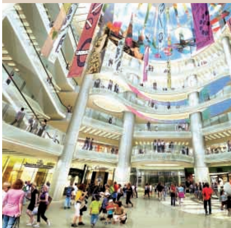
北京新東安市場的翻新工程將於二〇〇八年奧運會前完成，進一步鞏固商場作為當地居民及旅客娛樂消閑中心的地位。