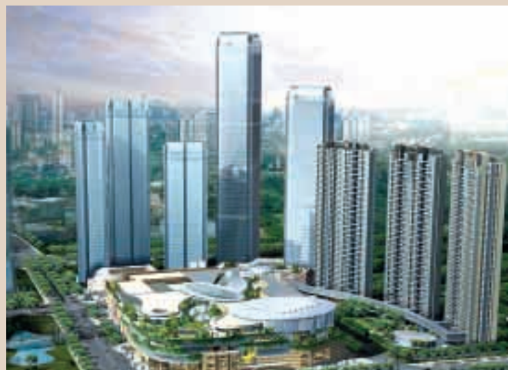
杭州錢江新城項目將包括豪華住宅、服務式住宅、寫字樓及商舖，總樓面面積達六百萬平方呎。