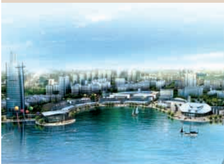
無錫太湖新城項目坐落於太湖旁邊，盡享自然怡人環境，將成為最優質的高尚住宅區。