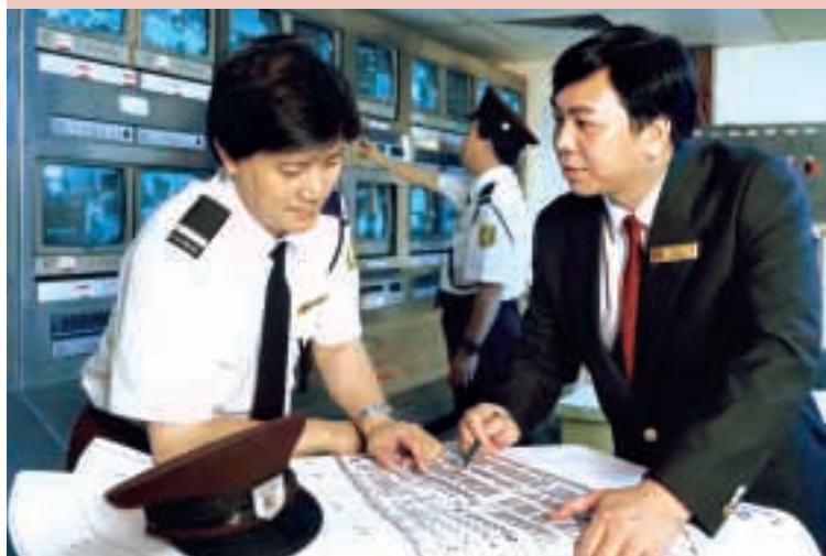
保安小組員工運用專業知識，為住戶提供最佳服務。