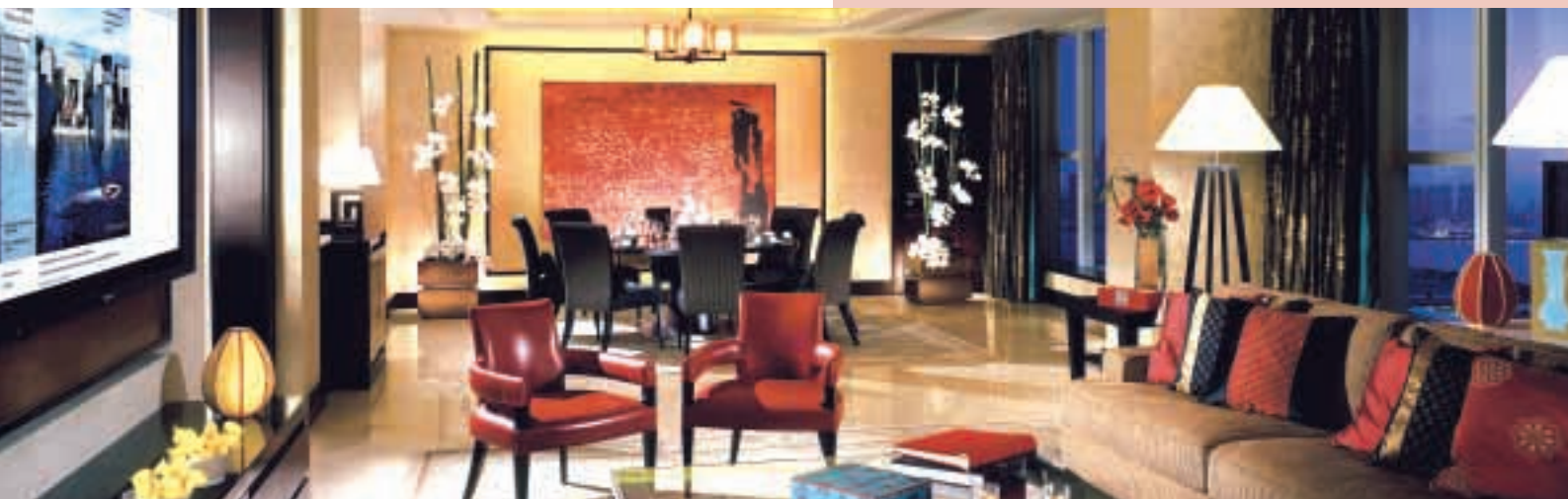
四季酒店憑藉頂級的住房設施，已吸納一批比較富裕及追求品味為主的長期顧客。