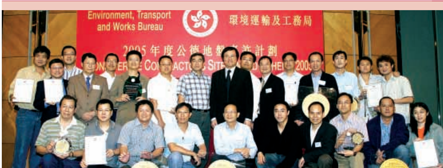
集團致力採取嚴謹的地盤安全措施，成效獲外界廣泛認同。