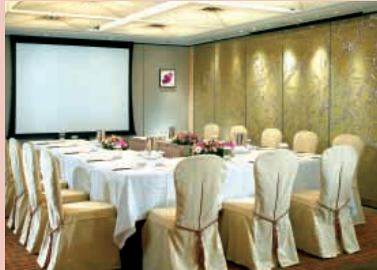
帝苑酒店憑藉獨特講究的設施，保持在市場的競爭優勢。