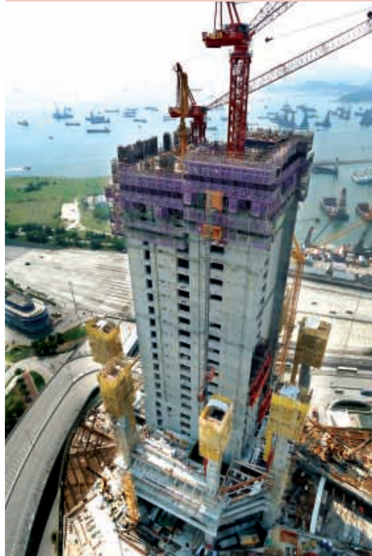
環球貿易廣場展示集團不斷引入新建築技術，以提升樓宇質素的典範。

儘管市場表現持續疲弱，新鴻基地產保險有限公司的營業額於回顧期內溫和上升至港幣二億九千九百八十萬元。該公司於除稅前之純利為港幣一億一千八百五十萬元，較去年度錄得港幣一億零一百三十萬元，增加百分之十七。該公司繼續透過不同渠道，包括直銷、專業中介及互聯網等提供全面的保險產品。面對市場嚴峻的競爭，該公司將重新組合及設計創新產品，以滿足特定的市場需要，務求取得健康增長。