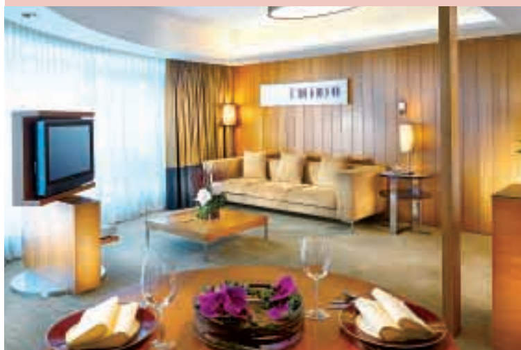
帝京酒店計劃進行翻新工程，將提供尊貴及現代化的房間設施。