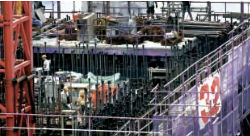
集團堅持以建造高質素物業為首要任務。