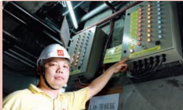
於建築工地內裝置消防警報系統，有效保障地盤運作順暢。