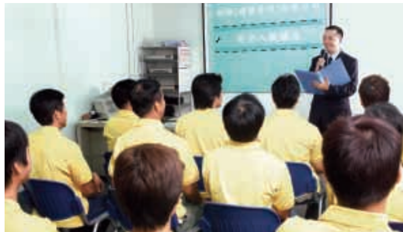
為員工提供定期培訓，有助增進對新建築技術的知識。

為更完善地配合業務發展，建築部旗下設有多間全資附屬公司，包括恒安工程有限公司、恒光工程有限公司、恒新工程有限公司、安輝機械工程有限公司及新成立的新輝園藝有限公司，為集團及其他客戶提供多種與建築相關的服務，包括機電及消防系統服務，建築設備與機械租賃及園藝工程。該部門並透過聯營公司永輝混凝土(香港)有限公司，為集團及其他承建商供應混凝土。