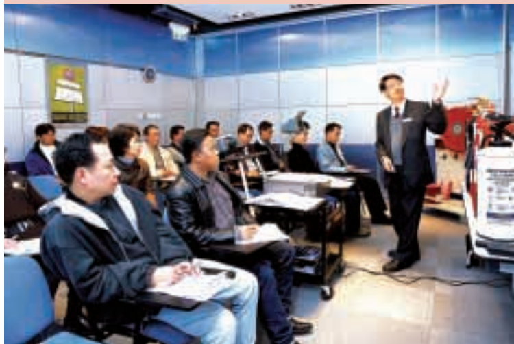
集團定期為員工安排全面培訓，以提升其服務水平。