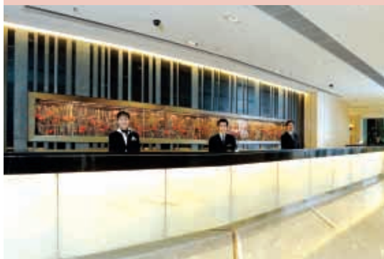
帝都酒店的大堂翻新後，為顧客提供更高水平的服務。

預期訪港旅客將持續上升，酒店業前景向好，集團對本地酒店服務業前景感到樂觀，並將緊握這個機遇，在九龍站項目興建的兩間新酒店，將分別由 Ritz- Carlton及W Hotels集團管理。集團同時正於汀九發展另一間優質酒店，落成後將提供約七百間客房。