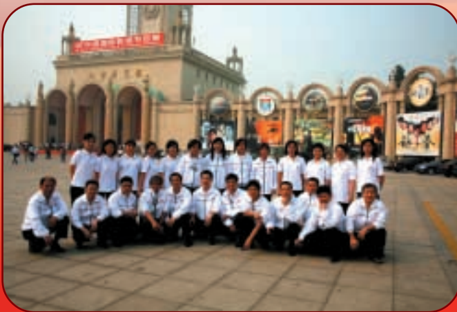
集團在內地各分公司之職員每年均前往北京，參加首都舉行之全國影視展覽會，同時作為內部同事溝通暢敘的一個項目。

截至年末，應收賬款（包括長期應收賬款）結餘為87,500,000港元（二零零五年：67,000,000港元），較去年上升31%。應收賬款之週轉日數（以平均應收賬款（包括長期應收賬款）除以年內之營業額再乘以年內日數計算）約為194天（二零零五年：159天）。