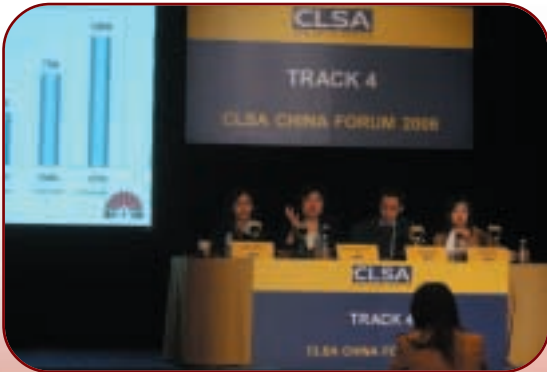
集團成為里昂證券2006年上海舉行之上市公司推介會中的推介對象之一。

中華人民共和國(「中國」或「境內」)經濟持續蓬勃發展，根據世界銀行預測，本年度中國國內生產總值預期增幅達9.5%(二零零五年：9.9%)。數據來源：國家統計局)。除了舉世矚目之二零零八年北京奧運會、二零一零年上海世界博覽會，二零一零年廣州亞運會等接踵而至之盛事，會帶動消費市場，增加境內與國際品牌之推廣意欲、刺激廣告費增長之外，國家勵行和諧家庭、小康社會等宏觀政策、以及持續之經濟開放政策下導致國際企業於境內林立、海外品牌得以實施境內本土生產策略等都能促使近年境內媒體廣告開支增幅穩定而樂觀。