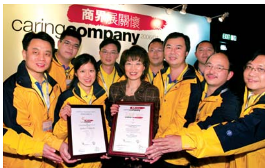
→ (左) 澳洲Reach計劃 → (右) 中電在香港獲得「全面關懷大獎」