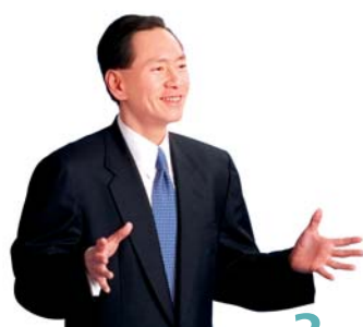
陳智思議員 香港社會服務聯會主席

中電一向重視企業社會責任。我們資助各種社區及教育計劃、與社區團體建立緊密的夥伴關係、推行家庭友善措施，鼓勵員工均衡作息，以及培育一群樂意奉獻私人時間，義務扶助弱勢社群的優秀員工。