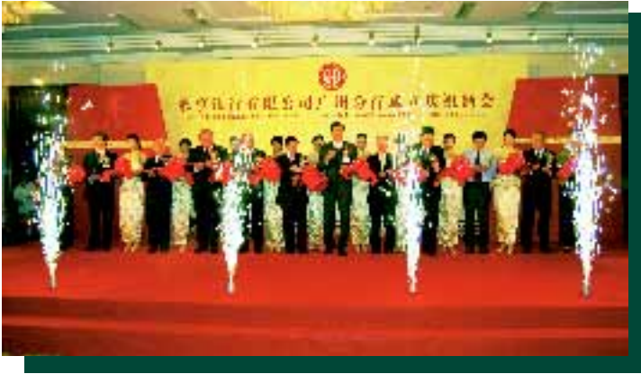
廣州分行成立慶祝酒會