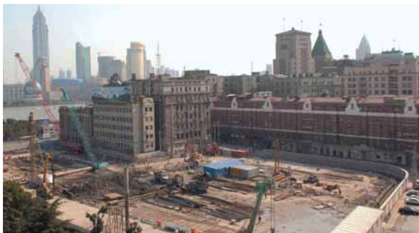
上海半島酒店的建築地盤