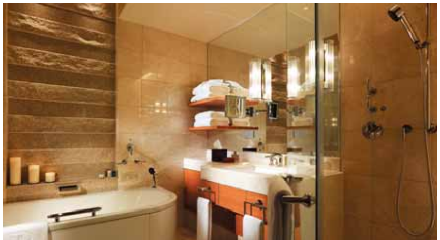
東京半島酒店客房的浴室

東京半島酒店於9月正式向傳媒介紹。酒店座落於丸之內區，面向皇宮及日比谷公園，毗鄰銀座。酒店將於2007年秋季開幕。