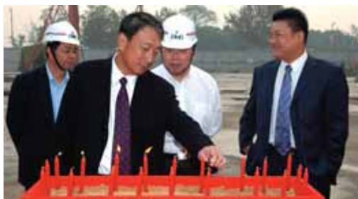
上海半島酒店動土儀式

三間餐廳、宴會設施、一所水療中心、購物商場以及一座獨立的住宅大樓。本公司擁有50%權益的上海外灘半島酒店有限公司的項目總成本初步估計為361百萬美元，包括地價總額109百萬美元以及有關的發展與建築成本。預期酒店將於2009年落成。