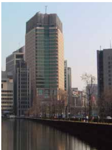
東京半島酒店壯麗外觀

經過接近兩年的建築工程，酒店已於2006年6月平頂，並已配置最後一條樁柱。外牆及內部的工程繼續加快進行。外牆已鋪上石材，大廈兩側的玻璃及青銅裝飾的裝嵌亦已