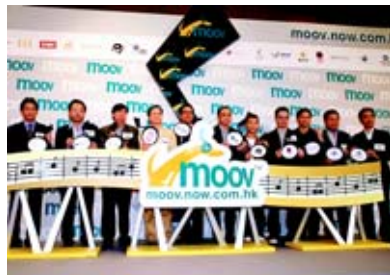
電訊盈科推出MOOV網上音樂庫服務，提供6萬首粵語及國際歌曲及音樂錄象。

電訊盈科獲得2006 Telecom Asia Awards的「最佳寬頻營運商（Best Broadband Carrier）」獎。