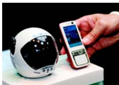
電訊盈科另一創新流動通訊服務—「視察易服務」。

電訊盈科流動通訊推出「電訊盈科視察易服務」，用戶可利用遙控流動電眼及3G手機，透過視象及音頻連接，視察家居或辦公室的情況。