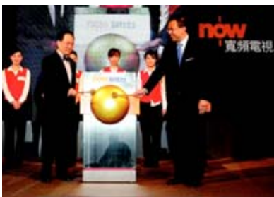
電訊盈科慶祝24小時「now財經台」隆重推出。

電訊盈科的24小時「now財經台」啟播，由新聞界精英及重量級分析員以粵語報導及分析最新本地及國際財經新聞。now寬頻電視除了推出Discovery頻道之外，亦增添在香港獨家播放的多條HBO頻道。