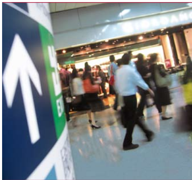
下圖租金上漲帶動車站商務收入增長

翻新工程完成後，共增加了四百六十八平方米的零售設施面積。然而，為方便與新商場Elements進行車站接駁工程，九龍站暫時損失二千六百七十一平方米的零售設施面積，導致車站總零售設施面積減少12%或二千二百零三平方米，至一萬六千八百六十七平方米。