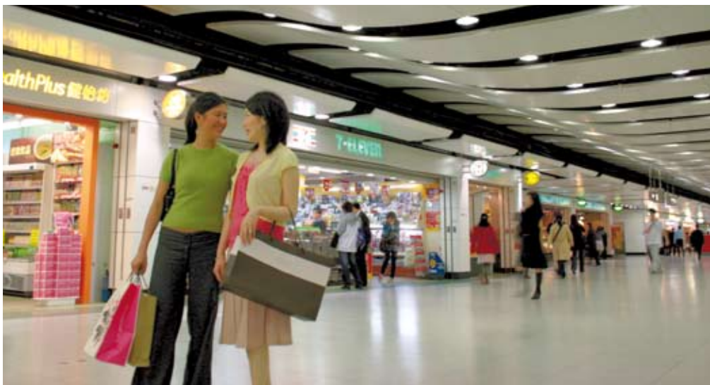
左圖 地鐵零售網絡新增商店三十二間，並引入十五個新商品類別及品牌

車站零售網絡新增商店共三十二間，並引入十五個新商品類別及品牌，其中包括LUSH、CEU、AEON、Sanrio Gift Gate及Durance等。