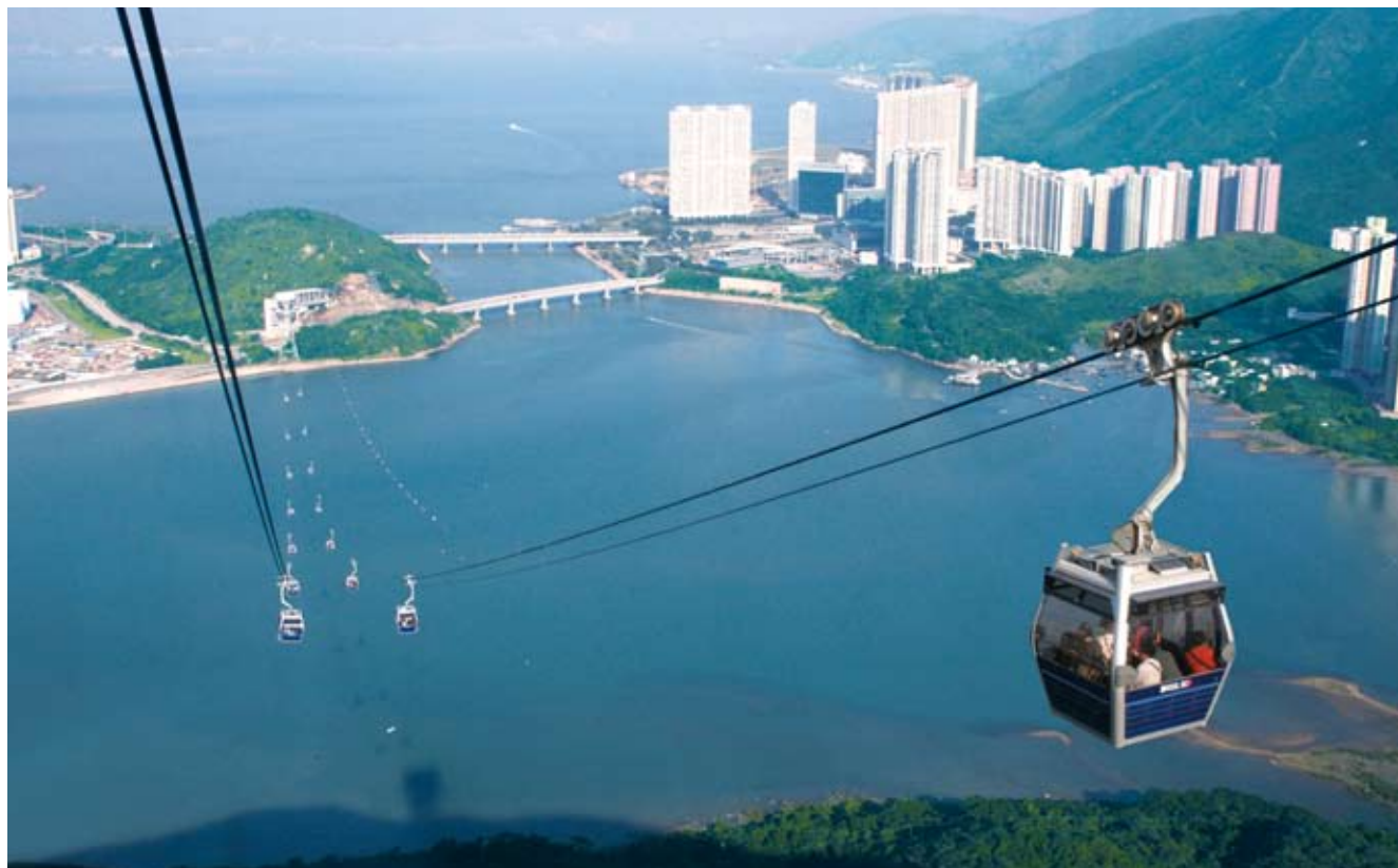
上圖「昂坪360」自九月啟用以來大受歡迎

在零售及公共服務方面，年內引入八達通卡付款系統的零售連鎖店包括超級市場、餅店及麵包店。八達通亦於二零零六年成功將服務擴展至其他新的範疇，包括教堂、展覽會、溜冰場、童裝店及洗衣服務。