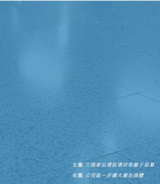
主圖 三個車站增設環回等離子屏幕 右圖 公司進一步擴大廣告媒體