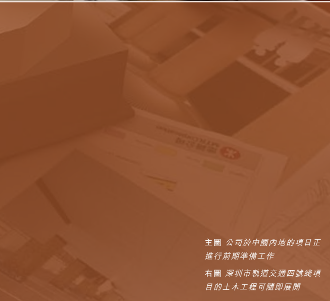
主圖 公司於中國內地的項目正進行前期準備工作