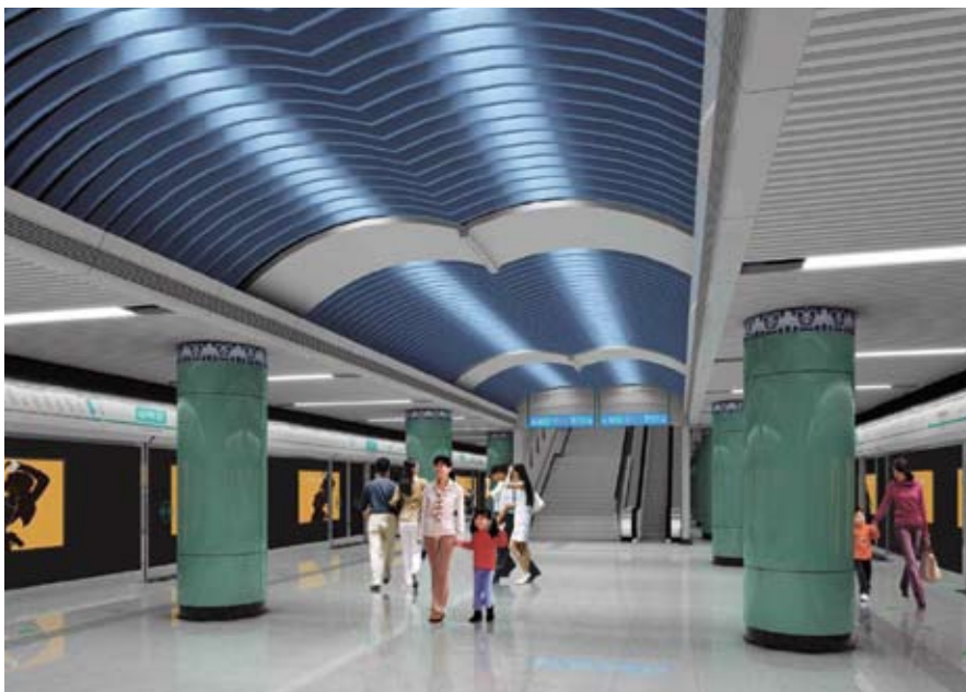
左圖北京地鐵四號線的特許經營、租賃及融資協議於四月簽署