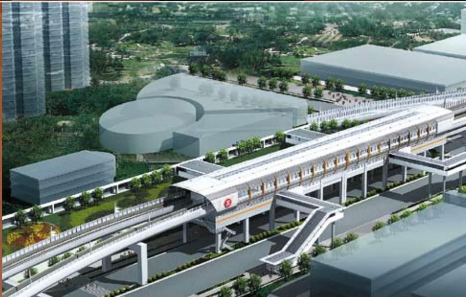
右圖 深圳市軌道交通四號綫項目的土木工程可隨即展開