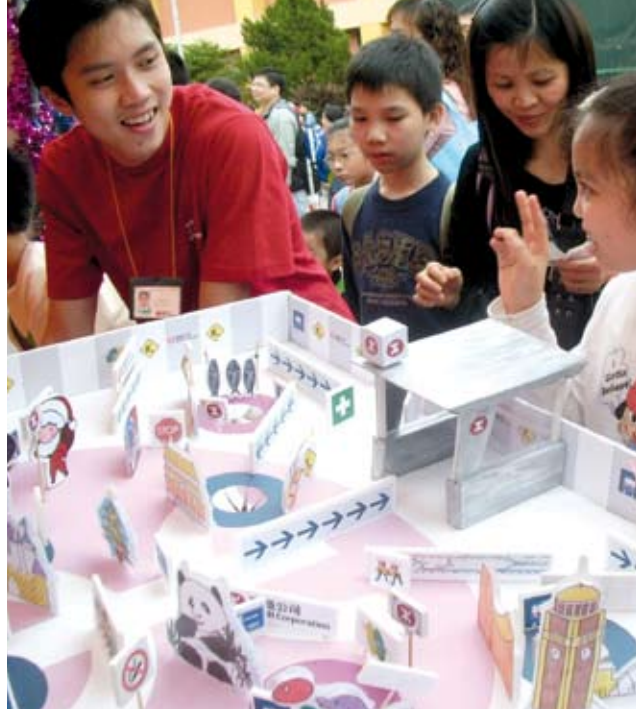
上圖「地鐵人·地鐵心」計劃舉辦了八十一個社區項目，參與義工逾一千五百名。

公司年內在培訓發展方面所得成績，包括兩名公司學徒獲職業訓練局頒發傑出學徒/見習員獎，公司已連續九年榮獲同類獎項。此外，十七名培訓導師成功獲得中國企業培訓師專業資格，有助公司發展中國內地的拓展策略。