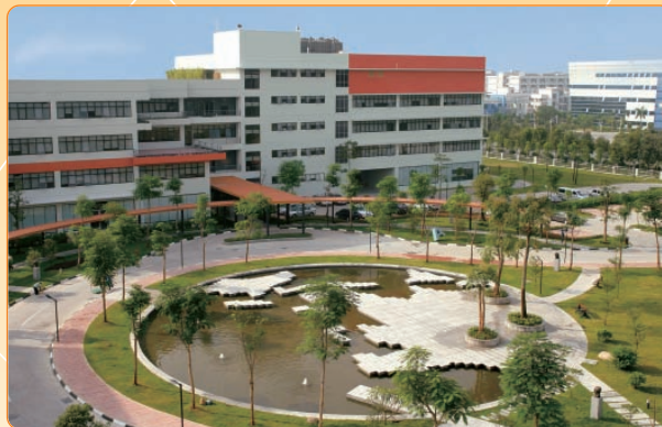
京信通信廣州科學城總部鳥瞰圖

九月：京信通信中國廣州科學城總部及擴充後的研發基地正式揭幕，展現世界級的研發設施，並為京信通信未來創新發展提供了堅實的平台。