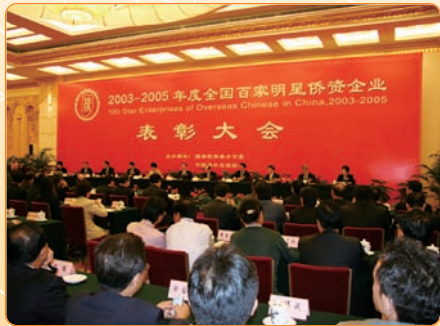
在北京舉行的表彰大會

九月：京信通信獲中國國務院僑辦授予「二零零三至二零零五年度全國百家明星僑資企業」。