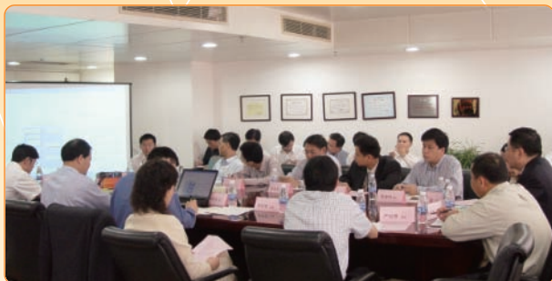
事業部重組後將體現協同效益及提高營運效率

四月：為配合公司未來發展需要，京信通信推行業務重組措施，創設了三個事業部：無線優化事業部、天饋事業部及微波事業部。