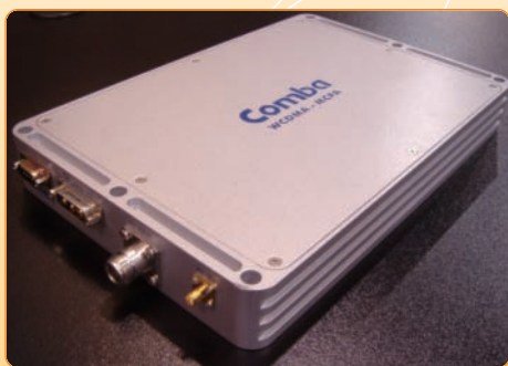
3G網絡多載波功率放大器由京信通信美國聖克拉拉之研發中心開發

四月：於美國拉斯維加斯舉行的CTIA Wireless 2006會議上，推出3G網絡多載波功率放大器(MCPA)。