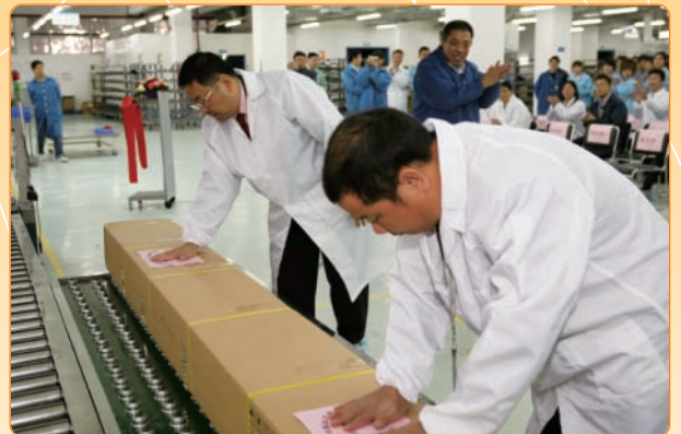
基站天線下線典禮