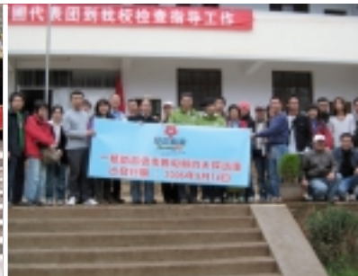
苗圃行動雲南慈善探訪團