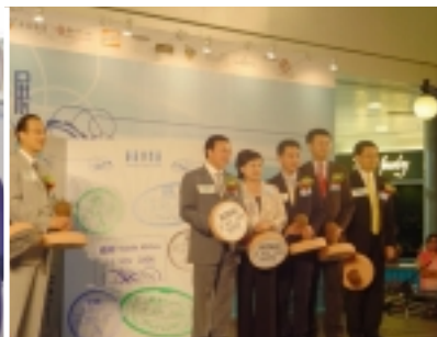
香港荷里活廣場之展覽 —2006旅遊博覽展