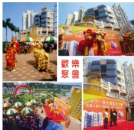
星晨廣場活動剪影

本集團擁有96.99%權益之星晨財務有限公司主要從事零售證券經紀服務。於回顧年度，該公司之營業額為2,500,000港元（二零零五年：2,400,000港元），經營虧損為3,300,000港元（二零零五年：虧損1,300,000港元）。