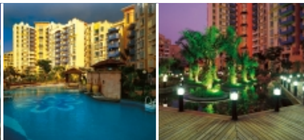
星晨花園第八期佛羅倫斯