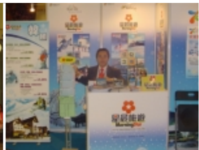
香港奧海城II期之展覽 —2006韓國繽紛滑雪嘉年華