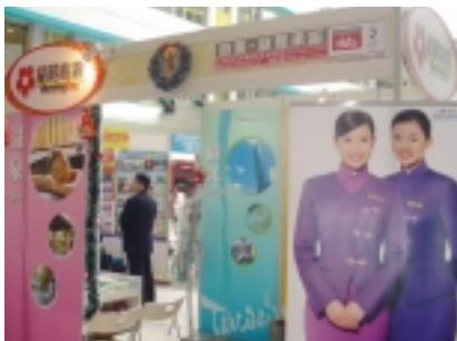
香港樂富中心之展覽 —2006台灣繽紛節

鑑於星晨旅遊持續致力於全面質量管理，於二零零六年十月成功取得ISO 9001:2000品質管理系統證書。此項國際認可證書再度肯定星晨旅遊對高水平質量之追求符合最佳標準。