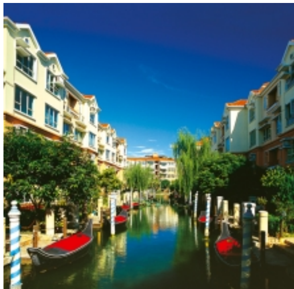
星晨花園第七期水城威尼斯