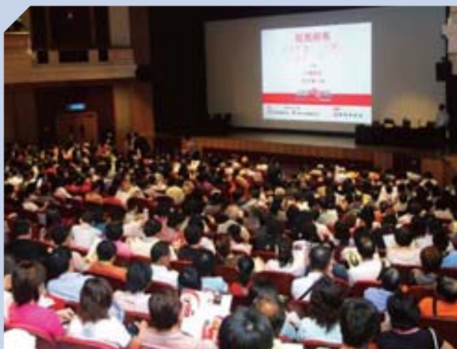
集團提倡關注心理健康，舉辦活動宣揚積極人生。

管理層深明僱員是集團最珍貴的資產，致力提供各種培訓及發展課程，幫助員工在個人及專業上充分發揮潛能。集團藉推行見習管理人員計劃，吸納香港及內地著名大學高水平畢業生，確保集團的優秀管理隊伍及企業文化持續發展。