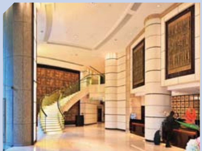
於今年六月開業的汀九帝景酒店，四周環境優美，提供逾六百間優質酒店及服務式套房。