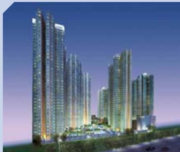
九龍紅灣半島是區內優質大型住宅。