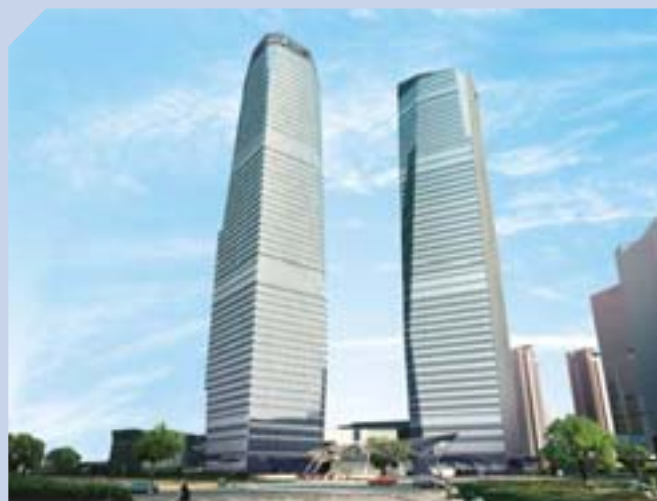
上海國金中心總面積逾四百萬平方呎，包括寫字樓、商場及兩間豪華酒店，將分期落成，整個項目將於二〇一〇年竣工。