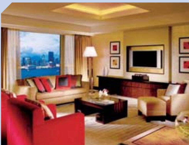
四季酒店的世界級服務深受本地及海外顧客稱譽。

二〇〇八年奧運會預料將令香港旅遊業於未來一年蓬勃發展。隨著內地及香港的投資機會不斷拓展，將進一步刺激訪港商務旅客增加。集團現正興建多間新酒店，為充分掌握商機作好準備，九龍站項目將包括兩間由Ritz-Carlton及W-Hotels管理的豪華酒店，集團亦正於上海國金中心興建優質酒店，亦將同時由Ritz-Carlton及W-Hotels集團分別經營。