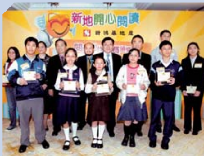
「新地開心閱讀」計劃積極推動全港的閱讀風氣。