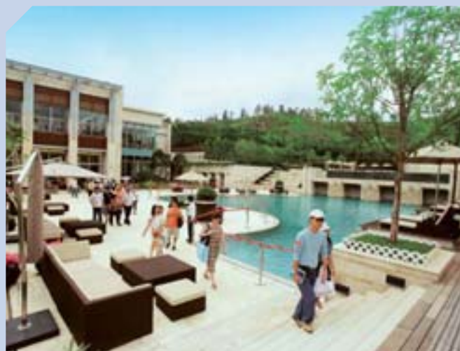
元朗葡萄園豪宅推出數星期內售罄。