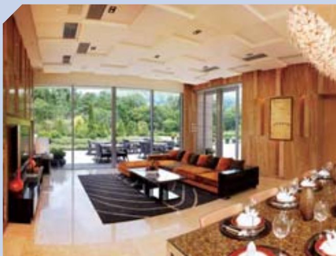
元朗葡萄園部分單位的客廳連接私家花園，與大自然和諧融合。

集團整體租金收益增長，主要由於旗下各類物業新租及續約的租金均有提升，其中位於核心區的寫字樓受惠於金融業發展蓬勃，企業擴充業務，導致租金增幅較大。集團擁有多元化的寫字樓組合，在這有利環境下表現出色。年內集團透過翻新旗下物業，以提升競爭力，而未來四年內新寫字樓項目將陸續落成，進一步增加集團的租金收入。