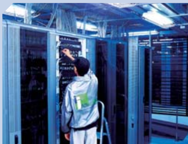
新意網旗下互聯優勢提供卓越數據中心服務。