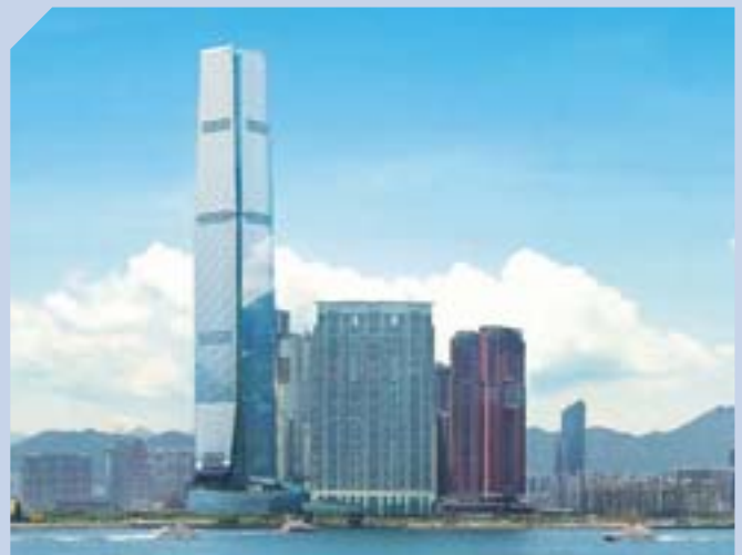
環球貿易廣場憑優越位置及先進設施，租務反應令人鼓舞，成功吸引首間大型投資銀行將總部遷往九龍。