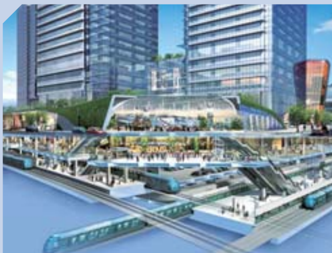
上海淮海中路項目包括高級商場、寫字樓及豪華住宅，並將連接現有及新建地鐵站，交通方便。

集團在上海另一個主要發展計劃為淮海中路項目，工程正在進行中，項目位於市內最繁盛的核心區，將興建高級商場、寫字樓及豪華住宅，樓面面積達二百五十萬平方呎，其中一百二十萬平方呎商場將成為上海市中心的新焦點。集團亦在黃浦江畔的濰坊發展一百七十萬平方呎豪宅物業，為上海開創豪華生活新里程。