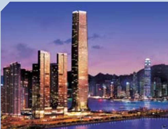
憑頂級質素及優越位置，九龍站天璽（右二及三）將會成為市場焦點。

因續租及新約租金有所增加，集團在香港的投資物業組合預期將繼續表現良好。核心地區的甲級寫字樓，由於供應緊張，租金仍將保持堅穩。由於勞動市場活躍，市民收入增加，加上旅客消費趨升，帶動零售業向好，這些利好因素都令商場租金繼續溫和上升。