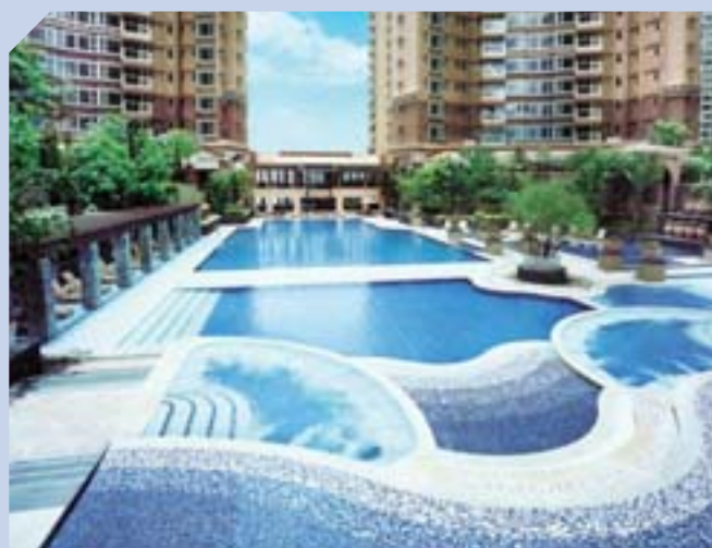
馬灣珀麗灣第五期的會所特設七十米戶外泳池，為區內罕有。