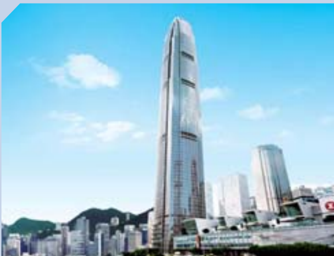
位於中環核心的國際金融中心繼續成為跨國企業，以及國際銀行和品牌的首選。

集團將透過定期翻新、舉辦推廣活動及重整租戶組合，維持旗下商場的吸引力。世貿中心是銅鑼灣最受歡迎的商場之一，其中九層寫字樓正改建為零售用途，竣工後商場面積將由十六萬平方呎增至二十八萬平方呎。上水廣場和荃灣廣場亦正進行翻新工程及商戶重組，完成後將煥然一新，為顧客提供更舒適的購物環境。