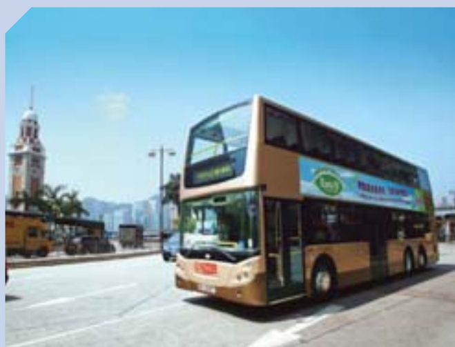
載通國際不斷提升服務質素，並積極開拓投資機會。

威信集團於期內表現良好，而三號幹線(郊野公園段)交通流量全年保持穩定。內河碼頭及機場空運中心繼續運作暢順。集團所有基建項目均在香港，長遠將為集團帶來穩定現金流量及回報。