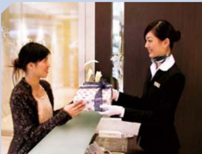
集團恪守以客為先的信念，提供最貼心的個人服務。

集團亦透過新地會接觸社群，採用不同渠道推廣和諧家庭訊息，貫徹集團「以心建家」的理念。該會為二十六萬會員提供各類與物業和購物相關的優惠，並定期舉辦消閑及康樂活動。新地會聯營信用卡更為會員提供多元化的折扣優惠及服務。