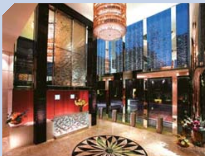
西九龍君滙港的住宅大堂設計瑰麗典雅。

截至二〇〇七年六月三十日，集團在港擁有土地儲備總樓面面積共四千三百五十萬平方呎，包括二千三百九十萬平方呎已落成的投資物業及一千九百六十萬平方呎發展中物業。按地盤面積計算，集團另擁有逾二千三百萬平方呎農地，大部分分佈於現有或計劃興建的鐵路沿線，正申請更改土地用途。集團將持續透過不同途徑於適當時機補充發展土地儲備。