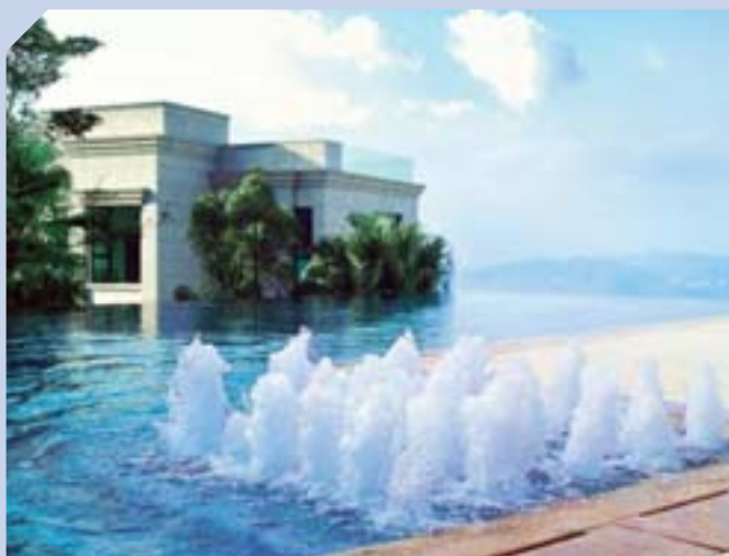
倚巒位處山頂傳統豪宅地段，地位超然。

截至二〇〇七年六月三十日，集團在內地擁有土地儲備共四千五百八十萬平方呎，其中四千二百八十萬平方呎為發展中物業，當中三千三百三十萬平方呎為高尚住宅，其餘是頂級寫字樓、商場及優質酒店；另有三百萬平方呎為已落成的投資物業，主要是位於黃金地段的寫字樓及商場，作長線投資用途。