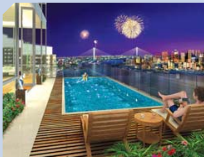
上海灘坊項目將興建一百七十萬平方呎的高級住宅及服務式住宅。