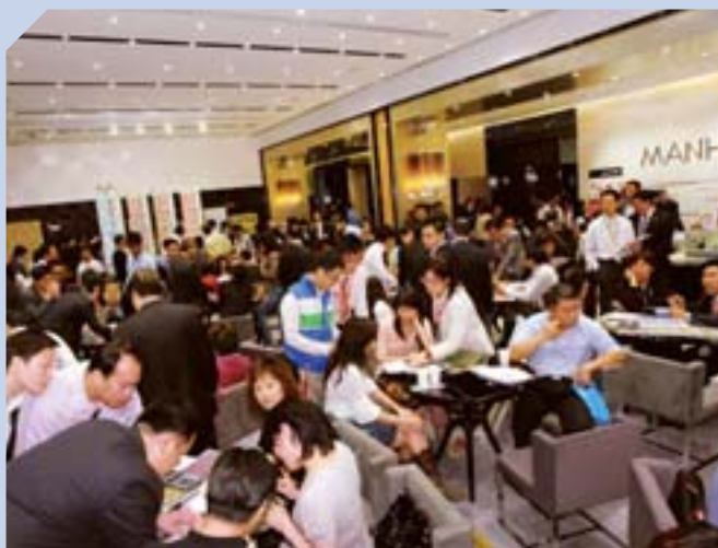
西九龍曼克頓山推售市場反應熱烈，深受自住和投資者歡迎。

集團於期內在本港完成六個項目，所佔樓面面積共四百四十萬平方呎，其中可供銷售住宅物業佔二百九十萬平方呎。除九龍站天璽將於數月內推售外，於年內完成的住宅單位幾近全部售出。