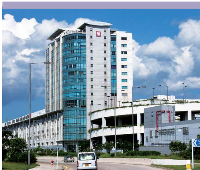
機場空運中心的收益於年內有所增長。

香港商用航空中心有限公司持有特許經營權，為進出香港的私人飛機提供服務。私人飛機的使用量持續上升，航空中心去年共處理超過二千八百航班架次飛機升降。為配合不斷上升的需求，第二個飛機庫已於二〇〇七年九月投入服務。集團持有該公司百分之三十五權益。