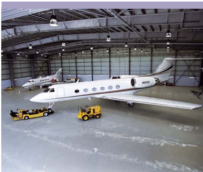
香港商用航空中心第二個飛機庫已於二〇〇七年九月投入服務，以應付日益增加的私人飛機使用量。