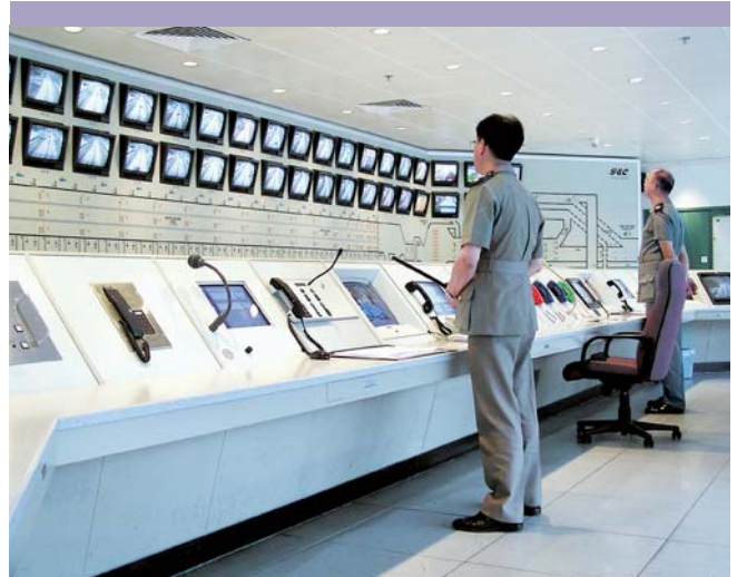
三號幹線(郊野公園段)配備精密儀器確保道路行車暢順。