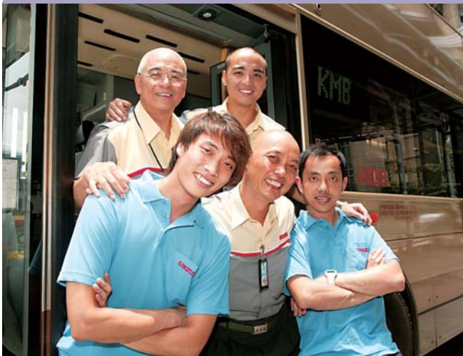
載通國際的員工竭誠為市民提供最優質的服務。