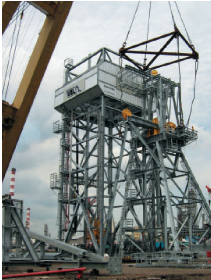
於新加坡船廠建造油井鐵架塔

全球對燃油之需求仍然殷切，導致對相關造船及離岸工程支援之需求日益殷切。憑藉新加坡及中山工廠設施之改良及合併影響為本集團帶來日益增長之造船及離岸工程市場之大量機會。該等項目包括造船、船隻維修及改裝，以及按特定要求進行之建造（例如油井之鐵架塔之豎立、裝備及安裝）。