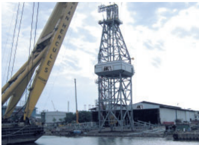
新加坡船廠 — Denlane Shipbuilding Pte Ltd

過去幾年，全球對燃油之需求殷切及穩定，而營運商有可能繼續投資於勘探及生產以填補耗盡之儲備。此現象導致對相關造船及離岸工程市場之需求亦殷切，本集團已準備就緒，以把握即將呈現之機會。除於新加坡及中山之現有工廠設施外，本集團正考慮長遠安排，以組合及使用中國東莞設施，此舉合併及綜合相互匹配及群聚之效應，以及提升造船、海事及離岸工程工業之產能。