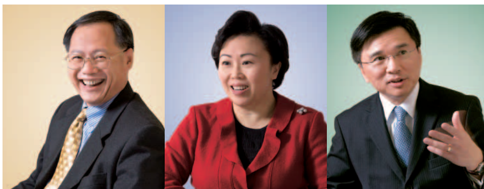
黃志光(運輸署署長)