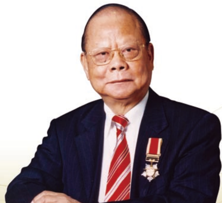
集團主席 曾憲梓博士，大紫荊勳賢