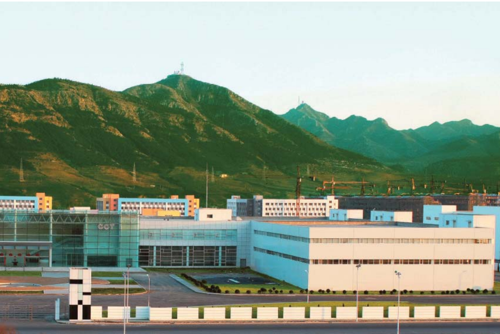
本集團位於中國遼寧省朝陽市的綜合廠房