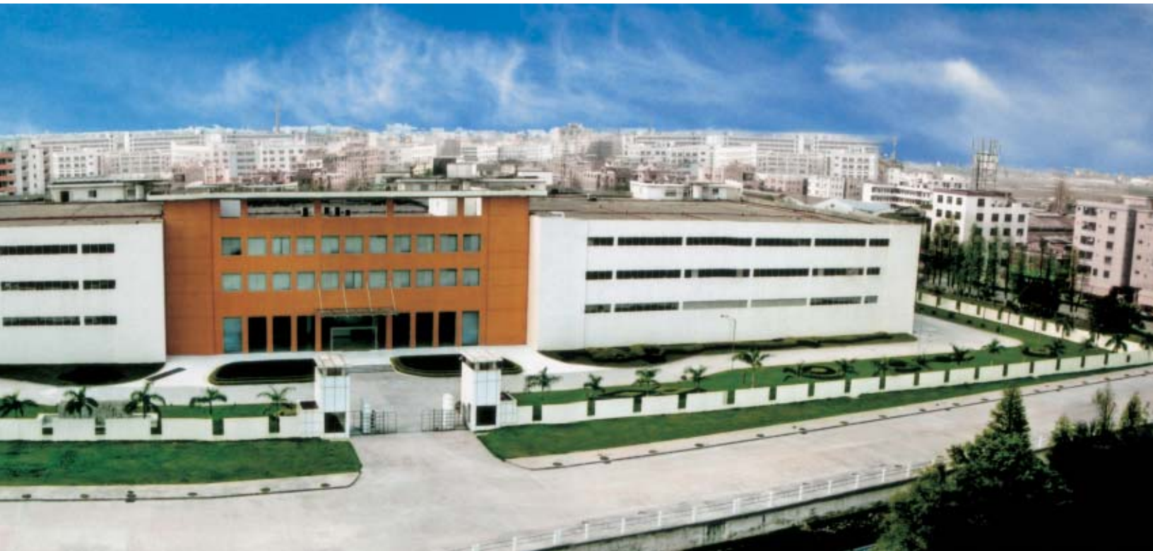
本集團位於中國廣東省東莞市的綜合廠房