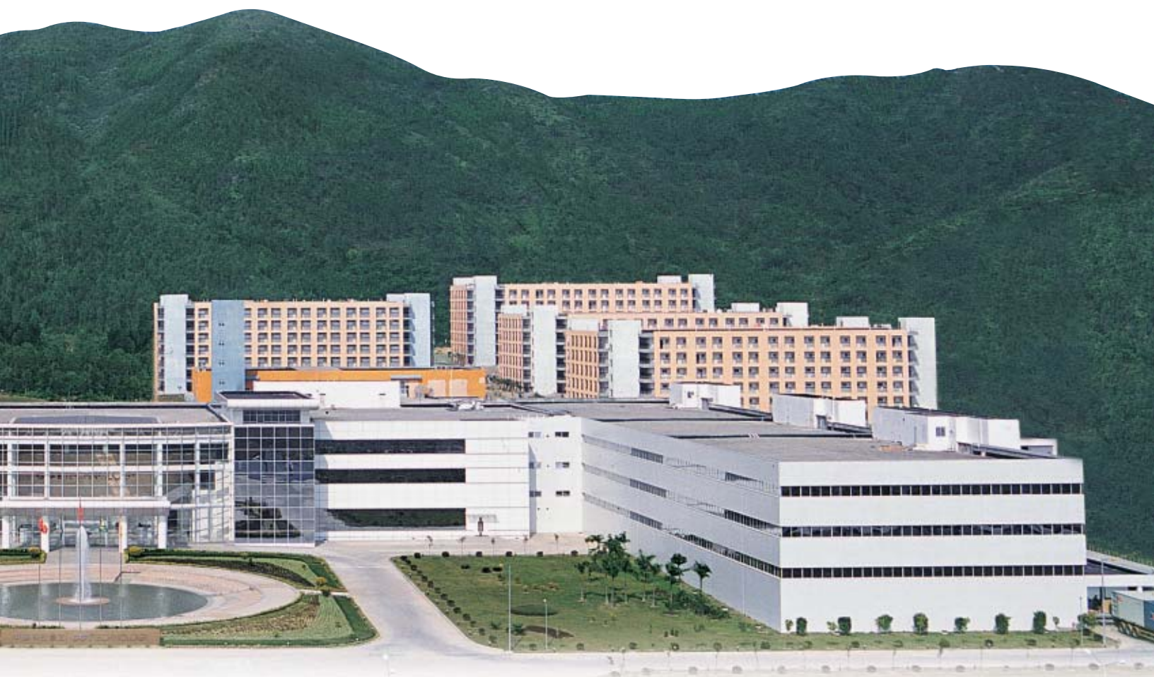
本集團位於中國廣東省惠陽市的主要生產基地——中建科技園