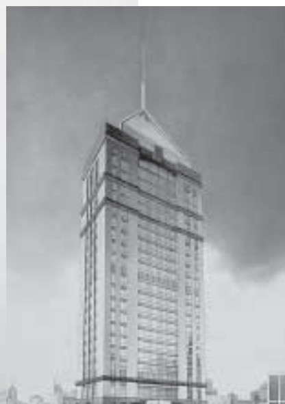
An elevation design of the building. 擴初設計大樓外貌。