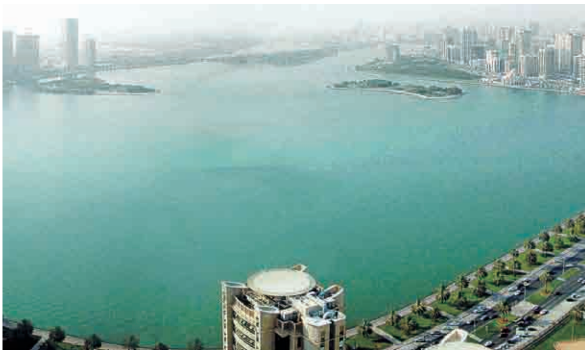
(阿聯酋沙迦海墻項目，海墻二期項目是沙迦海岸線擴展計劃的重要內容，受到當地政府的廣泛關注。)

2008年上半年公司海外業務新簽合同額39.20億美元。相繼中標的有沙特阿拉伯曼哈頓港口項目、沙特阿拉伯祖爾角海港建設EPC項目等項目。新簽合同額中大型項目所佔比重不斷增多，項目主要集中在非洲和中東地區，二零零八年上半年新開闢的市場有利比亞和馬拉維等國家。