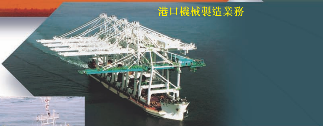
港口機械製造業務