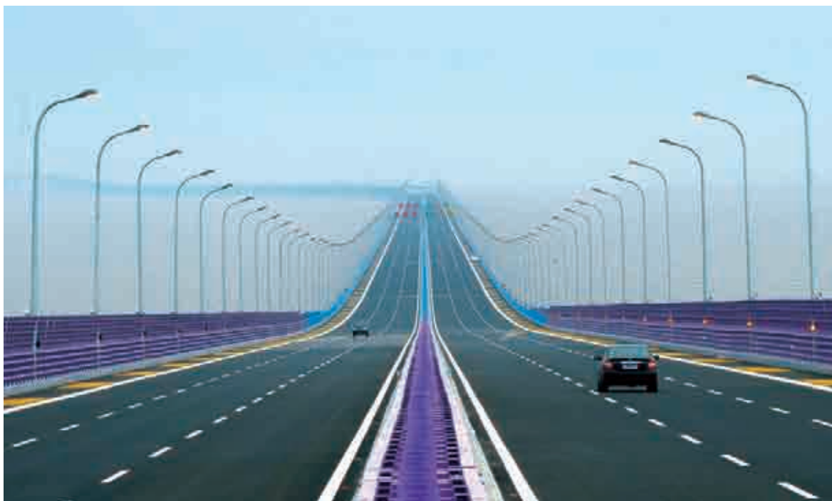
(杭州灣大橋，設計單位在勘察、設計、施工等方面攻克技術難關，形成了9大系列自主核心技術，6項關鍵技術達到國際領先水平。)

2008年上半年公司基建設計新簽合同包括平南高速公路勘察設計、國家高速公路網橫12杭州至麗江雲南段勘察設計、斯里蘭卡漢班托塔港一期工程勘察設計等項目。