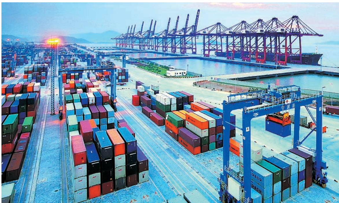
(寧波港北侖集裝箱碼頭，四期、五期項目共10個萬噸級以上泊位，到2010年吞吐能力將達到1,000萬標箱。)

2008年上半年公司於中國大陸的港口建設工程新簽合同額為149.39億元，保持穩定增長態勢，主要包括天津港臨港工業港區1號碼頭工程、盤錦船舶工業基地海上舾裝碼頭一期工程等國家重點工程項目。