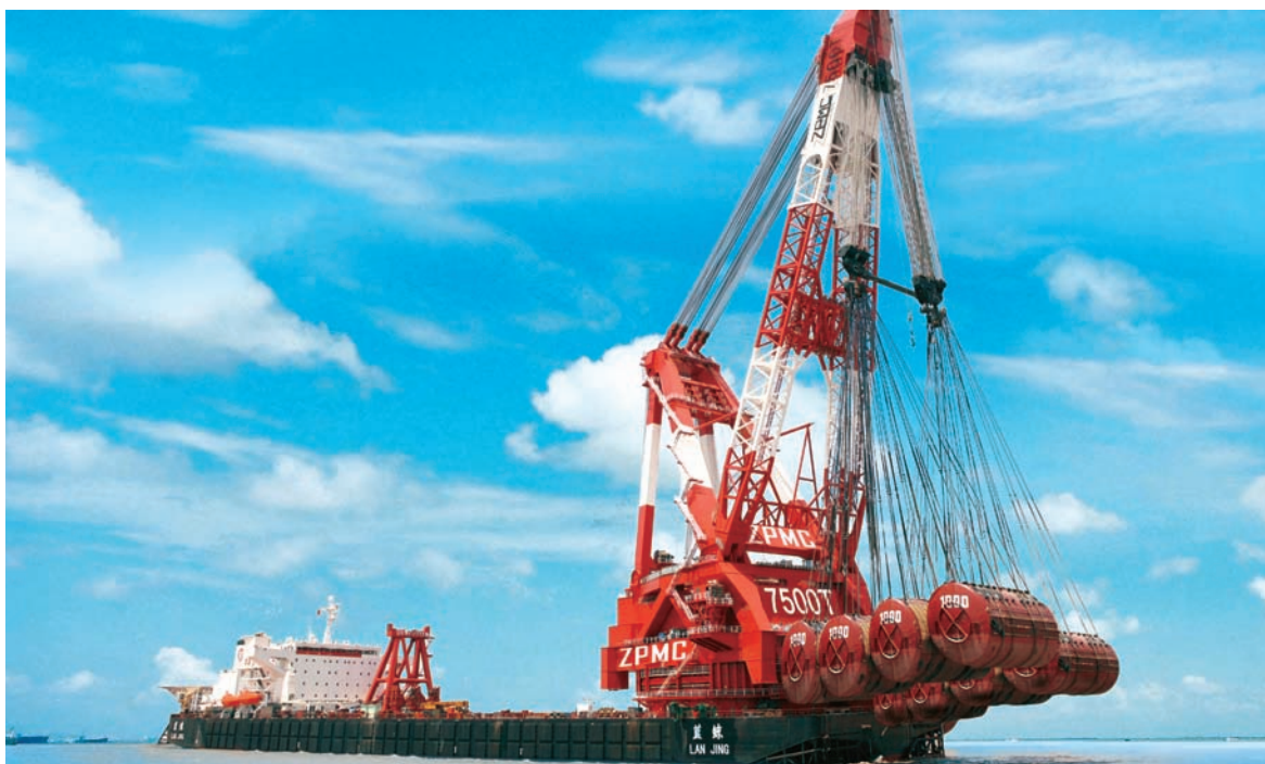
(「藍鯨號」全回轉自航起重船，額定起重量7,500噸，是我國自主研发的世界最大起重船，具有無限航區。)

2008年上半年振華港機集裝箱業務共完成總裝產品359台，比上年同期增長16.9%。海上重型裝備、鋼結構橋樑等新產品全面啟動，7,500噸全旋轉浮吊完成吊重和錨泊試驗並交付使用，美國新海灣大橋進入實質性的生產製作和全面拼裝階段，外高橋龍門吊整機順利卸船再創整機運輸的紀錄。