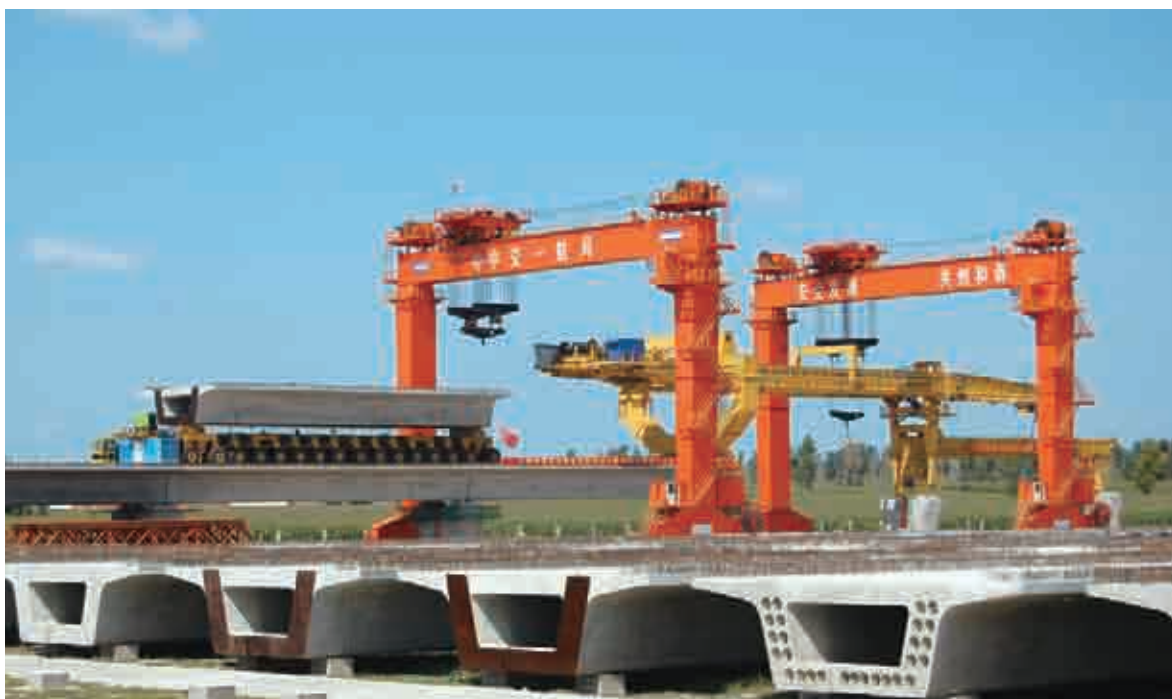
(哈大客運專線鐵路，首片桁梁澆鑄儀式。)

2008年上半年公司於中國大陸的鐵路工程新簽合同額為137.19億元人民幣。上半年公司成功簽署了京滬高速鐵路等項目，在建項目太中銀鐵路、哈大客運專線鐵路、京滬高速鐵路等項目進展順利。截至2008年6月30日，公司累計承擔鐵路施工項目20個，線路總里程約1,058公里。公司在鐵路項目建設方面，認真研究合同條款、掌握工程技術標準，加強施工過程的管理和成本控制，牢牢把握項目管理各要素的合理配置，爭取項目的最大效益。