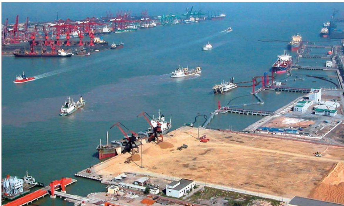
(天津港航道拓寬一期工程，工程量915萬方，滿足15-20萬噸級船舶通航。)

2008年上半年，公司完成疏浚工程量約為3.95億立方米，約佔中國境內疏浚工程總量的75%，其中，基建及維護性疏浚約2.41億立方米，吹填造地約1.54億立方米。上半年新投入使用的專業大型船舶4條，按照標準工況條件下每年新增產能為4,500萬方立方米。下半年預計將有6條大型專業船舶投入運營，按照標準工況條件下每年新增產能為5,818萬方立方米。