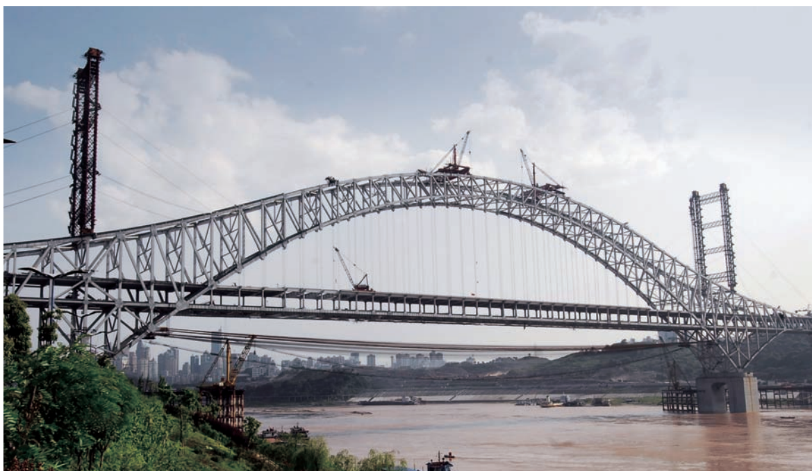
(重慶朝天門長江大橋，大橋主體全長1,741米，是世界同類型橋樑中跨度最大的鋼桁系杆拱橋。)

2008年上半年公司於中國大陸的投資業務新簽合同額為65.35億元。上半年建立和完善了BOT、BT項目的相關管理制度，加大執行力度、強化風險管控。在項目的選擇方面，公司進行充分的調研，嚴格認真地評估論證，遴選符合條件的項目，最大限度地降低風險。