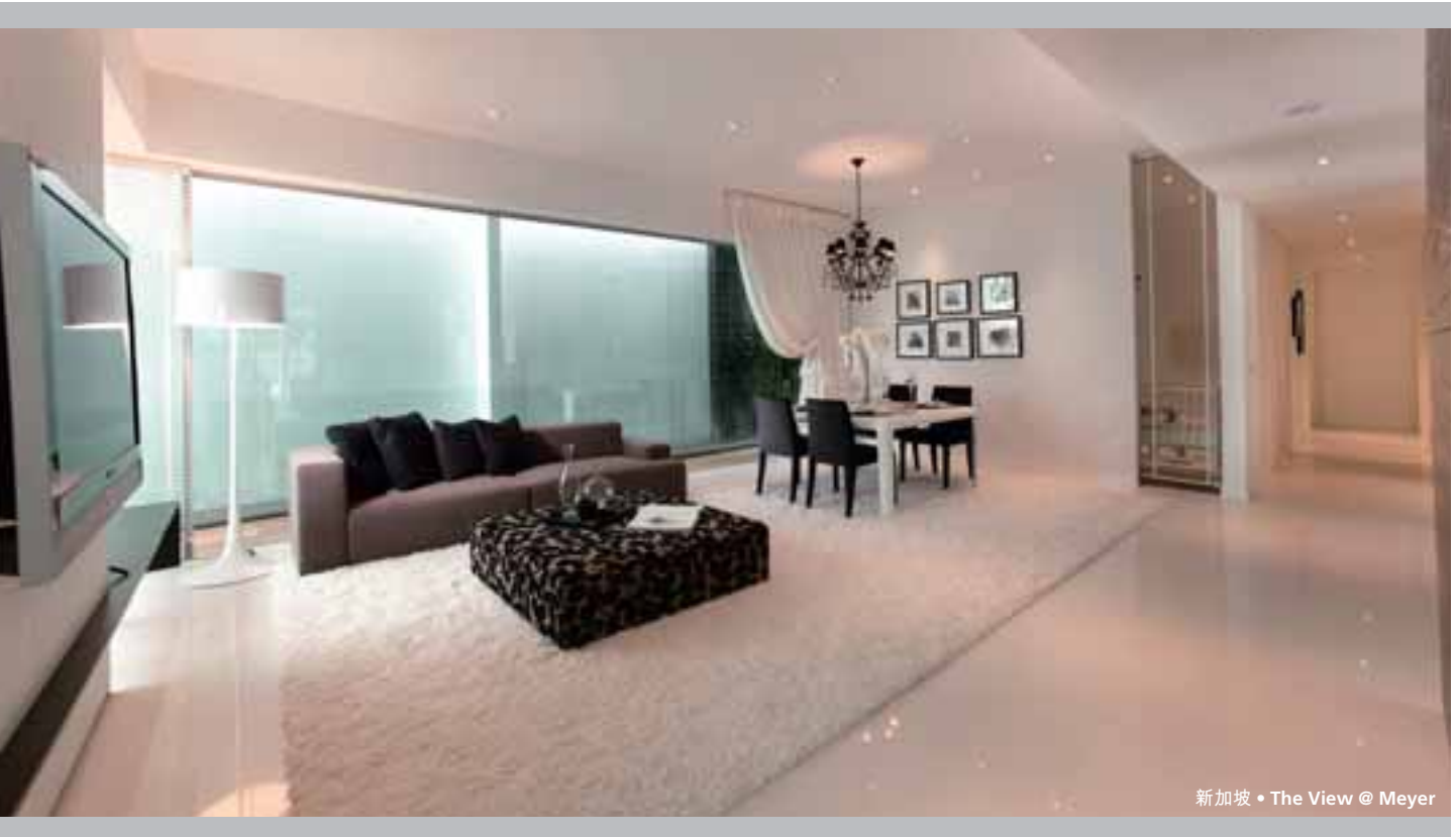
新加坡 • The View @ Meyer