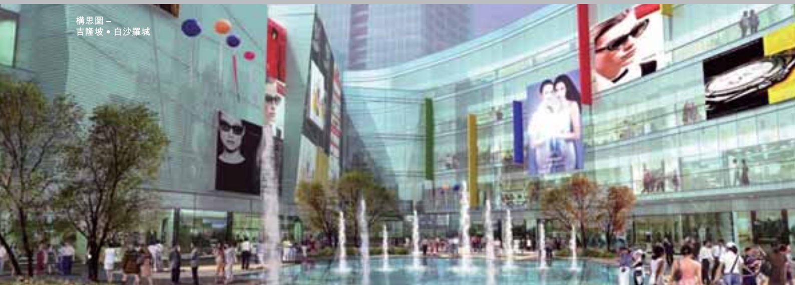
構思圖 - 吉隆坡 • 白沙羅城

面對全球經濟增長放緩、全球信貸緊縮及通脹升溫，馬來西亞物業市場似乎有所回軟。由於建築成本上升，發展商把項目推出發展之步伐放慢，而買家承接力亦相應減少。儘管對房屋之需求較弱，基於政府政策使自置居所更具吸引力，國浩房地產對中期物業市況將保持正面審慎樂觀之態度。馬來西亞物業之價格亦為同區域中最低。