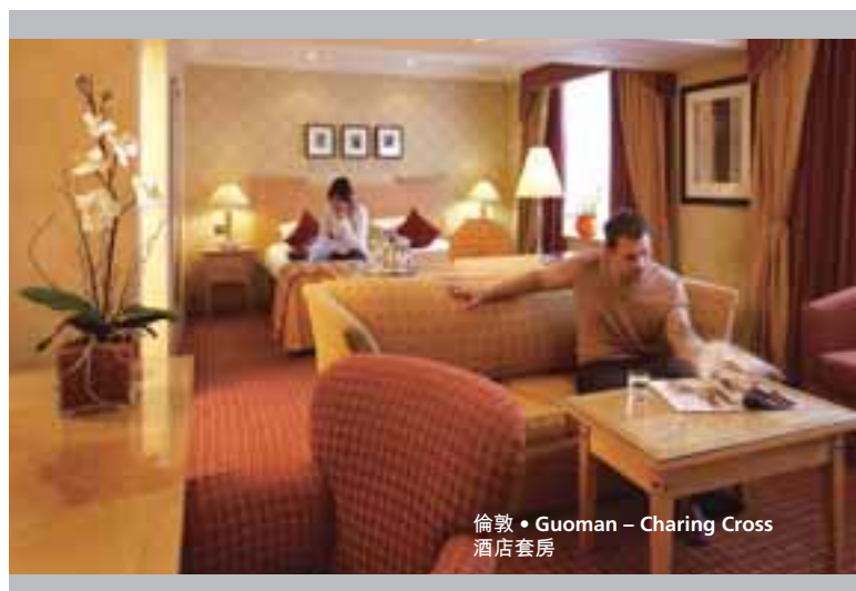
倫敦 • Guoman – Charing Cross 酒店套房

CGB進行之分拆行動，包括向股東分派現金及分派其於GL之股份，已於二零零八年八月完成。本集團現時直接持有GL54.1%之股權。於分拆後，CGB將於馬來西亞股票交易所撤回其上市地位。