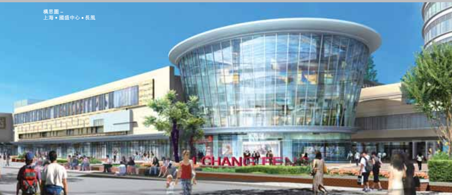
構思圖 - 上海·國盛中心·長風

中國在二零零八年第二季之國內生產總值增長10.1%，相對過去一季為10.6%。通脹率於六月由過去一個月之7.7%回落到7.1%。由於發展商面對信貸緊縮、銷售減慢及價格下跌，物業市場似乎開始降溫。儘管經濟及物業市場發展放緩，國浩房地產相信，經濟將繼續在宏觀經濟政策之框架，以及政府為防止經濟過熱及打擊通脹實行之其他規管措施下繼續增長。預期優質住房之中期需求為穩定。