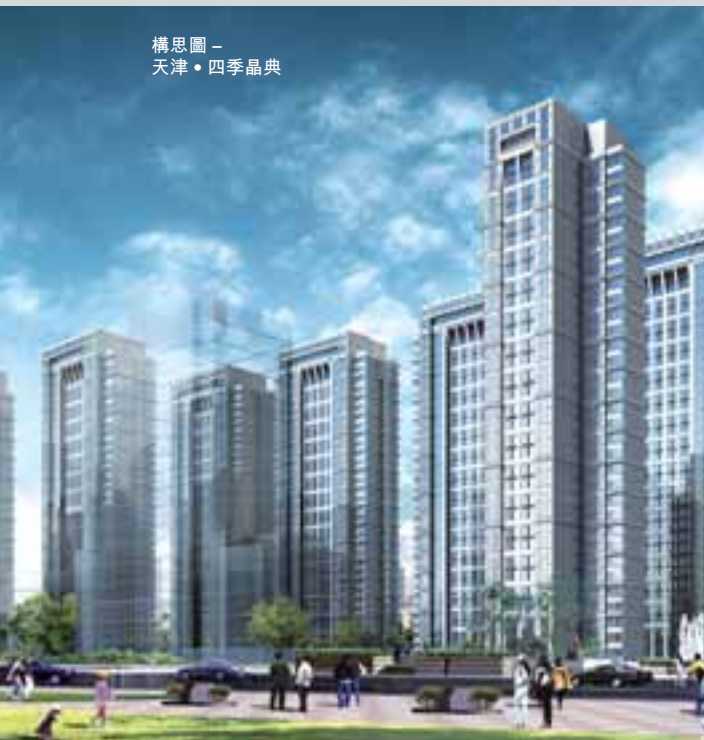
構思圖 - 天津 • 四季晶典

國浩經營之附屬公司及投資業務主要位於香港、中國、新加坡、馬來西亞、越南及英國。國浩四項核心業務分別為自營投資、物業發展及投資、酒店及休閒業務，以及金融服務。