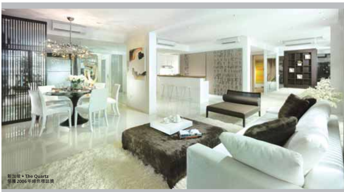
新加坡 • The Quartz 榮獲2006年綠色標誌獎

國浩房地產之聯營公司對截至二零零八年六月三十日止財政年度除稅後溢利之貢獻為1,150萬新加坡元，當中主要包括國浩房地產在本財政年度增持馬來西亞之Tower Real Estate Investment Trust(「Tower REIT」)之權益，從15.00%增至19.97%，故此產生負商譽1,060萬新加坡元。Tower REIT現時為國浩房地產之聯營公司。