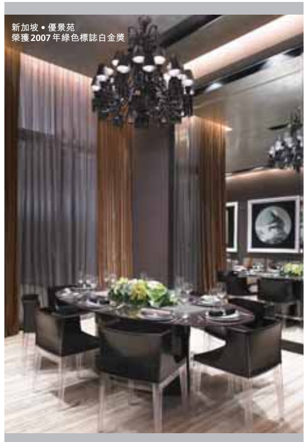
新加坡 • 優景苑 榮獲 2007 年綠色標誌白金獎

新加坡之國內生產總值於二零零八年第二季增長 2.1%，而二零零八年首季為 6.9%。二零零八年國內生產總值增長預測已由 4%-6% 向下修訂為 4%-5%。市區重建局之統計數據顯示，二零零八年第二季之私人住宅物業價格增加 0.2%，相對過去一季增加 3.7% 有所回落。物業市場氣氛轉趨審慎，新推出物業項目有所減少及延遲，以及買家承接比例相對二零零七年較低得以證明。正在興建中之兩個綜合渡假村及 Marina Bay Financial Centre 及其後落成，應有助未來幾年之經濟增長。國浩房地產預期，住宅物業之需求於中期仍保持穩定。