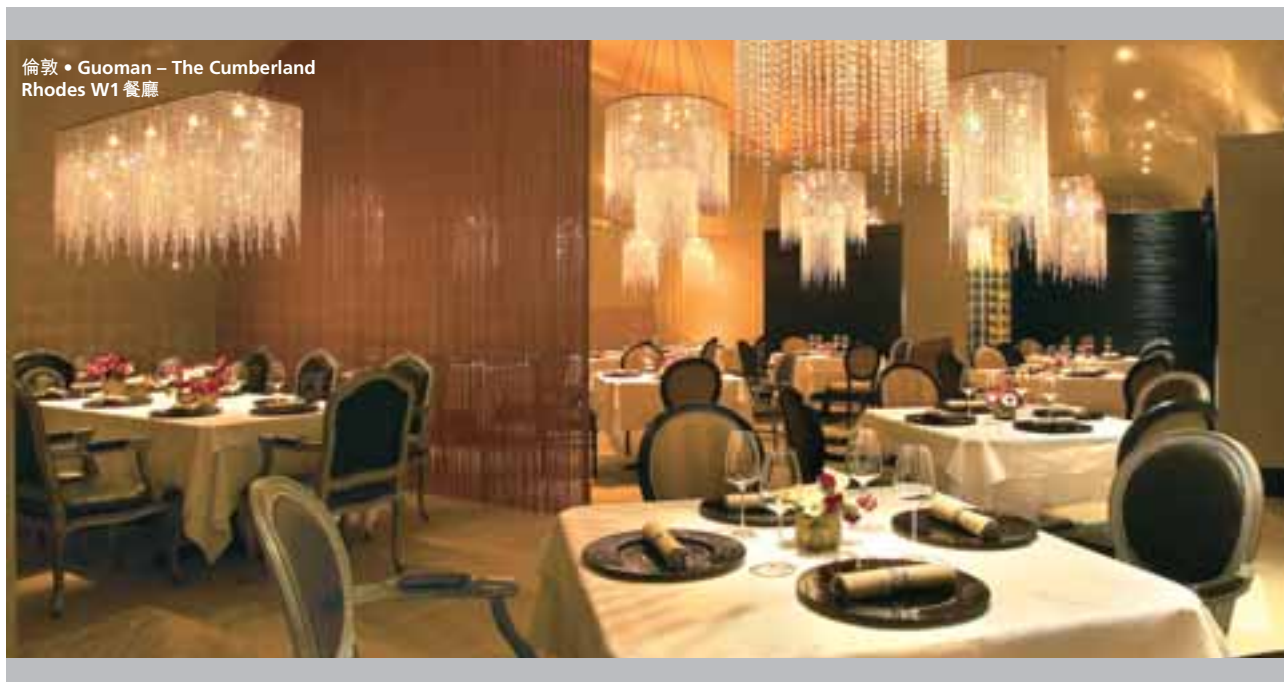
倫敦 • Guoman – The Cumberland Rhodes W1餐廳

善、巴斯海峽石油及燃氣所得之特許權收入有所增加、於斐濟Denarau之土地及已發展物業銷售上升，以及博彩業務之收益有所改善。酒店業務之收益增加，為本財政年度相對上一個財政年度之平均可出租客房收入增加所致。於澳洲巴斯海峽石油及燃氣所得之特許權收入增加，大部份歸因於在二零零七年七月全面贖回巴斯海峽石油信託(Bass Strait Oil Trust)之普通單位，自此以後，GL享有於澳洲巴斯海峽石油及燃氣所得之全部特許權收益，以及原油價格上升。