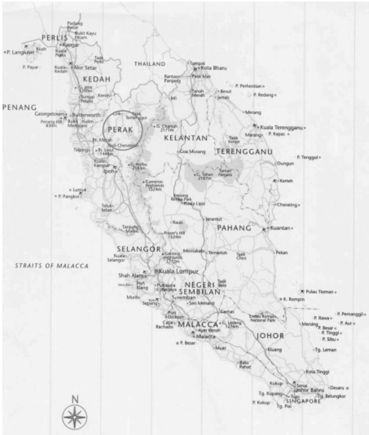
馬來西亞地圖及霹靂州的位置