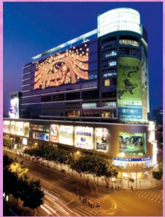
廣州五月花商業廣場