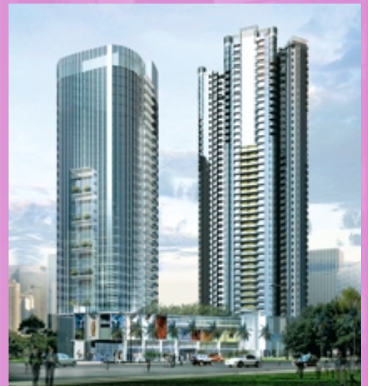
廣州海珠廣場(構想圖)