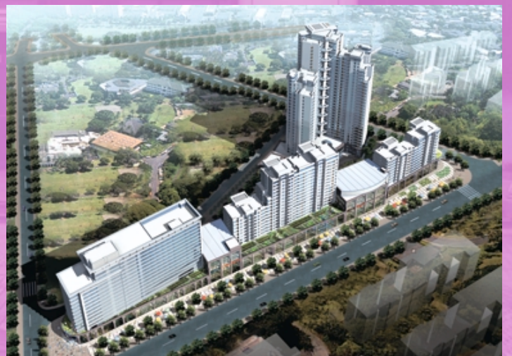
上海五月花生活廣場(構想圖)