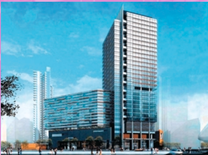
廣州東風廣場第五期(構想圖)