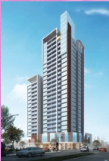
廣州觀綠路項目(構想圖)