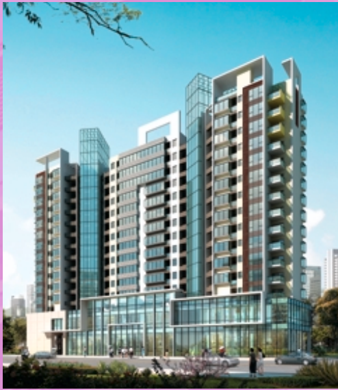
廣州東華東路項目(構想圖)