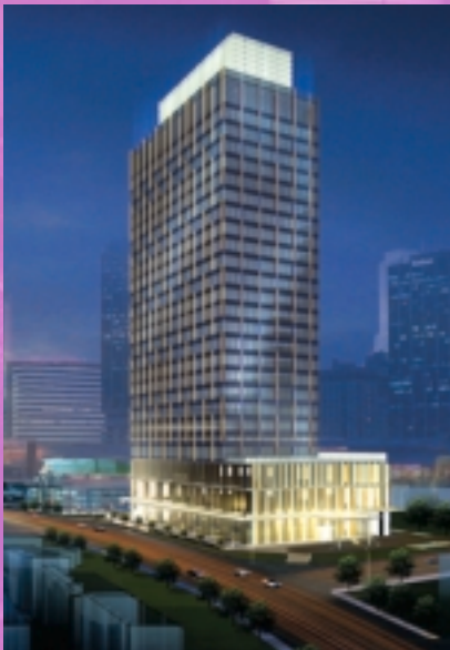
上海閘北廣場二期(構想圖)