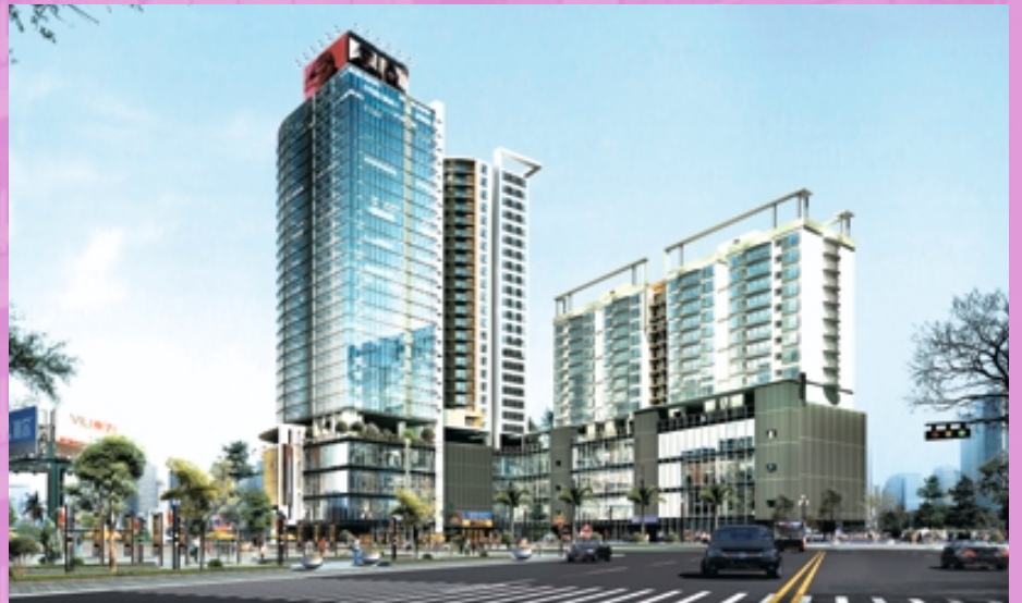
廣州富邦廣場(構想圖)