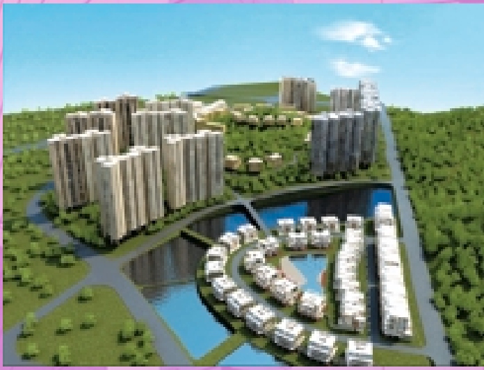
廣州金沙洲項目(構想圖)