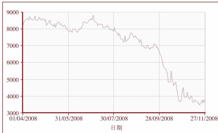
倫敦金屬交易所三個月A類期銅價 X軸代表A類銅每噸美元數。

誠如上文所述，金融海嘯影響商品價格。下圖說明倫敦金屬交易所所報A類期銅價自二零零八年七月起呈現下行走勢。二零零八年十一月後期倫敦金屬交易所所報三個月A類期銅價甚至降至約每噸3,700美元。