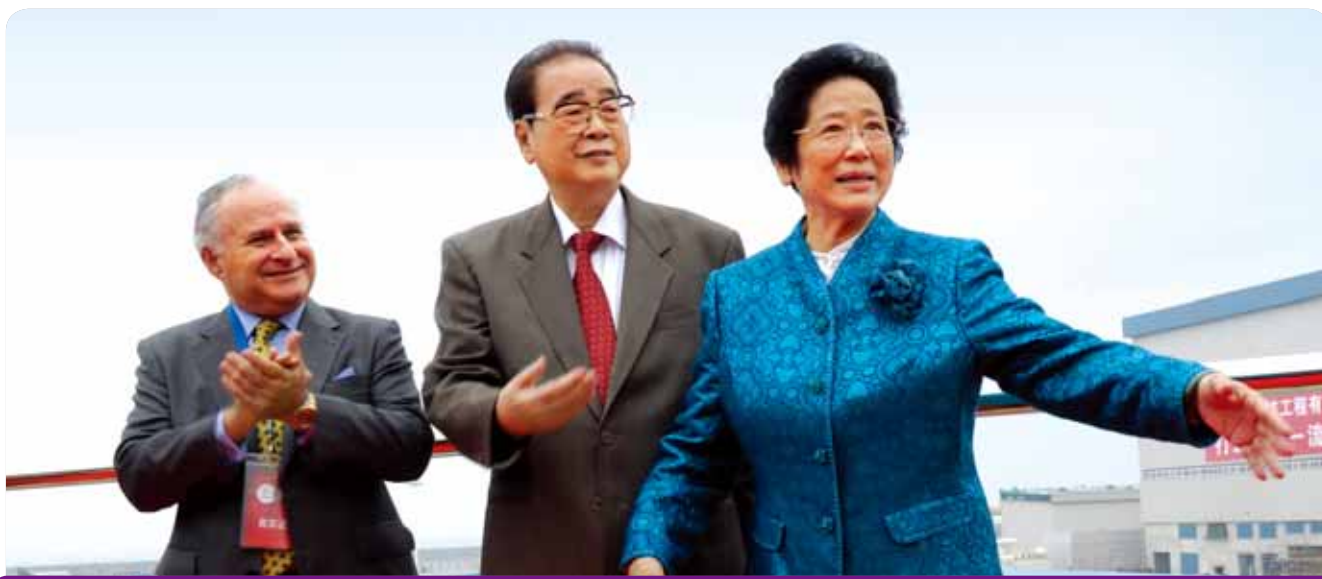
在大亞灣中國改革開放30周年論壇上與前國家領導李鵬及夫人朱琳敘舊

諒解備忘錄除了為香港天然氣供應確立新方向外，亦帶來了另一個喜訊——大亞灣核電站首階段核電供應在2014年屆滿後，將繼續為香港供應核電20年。核電站自1994年投產以來，已成為香港一項潔淨、可靠的重要電力來源，佔2008年中電發電量約30%。中電將與內地的合作夥伴，包括中國廣東核電集團有限公司（「中廣核」），商討為香港繼續提供核電所需的安排。