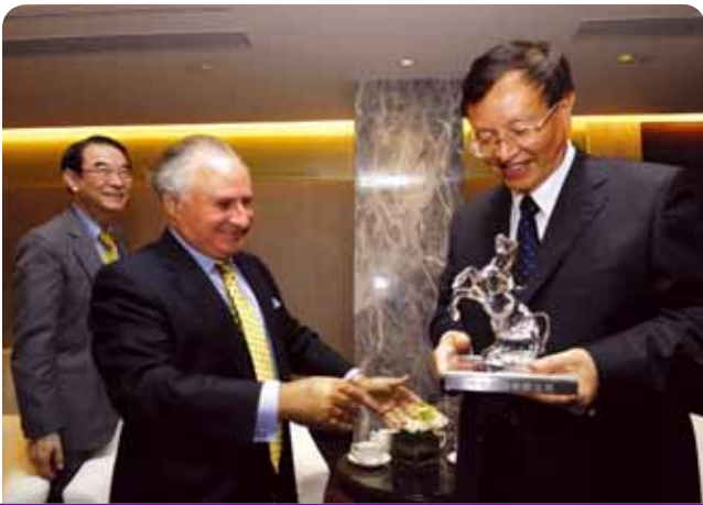
與發改委副主任張國寶...