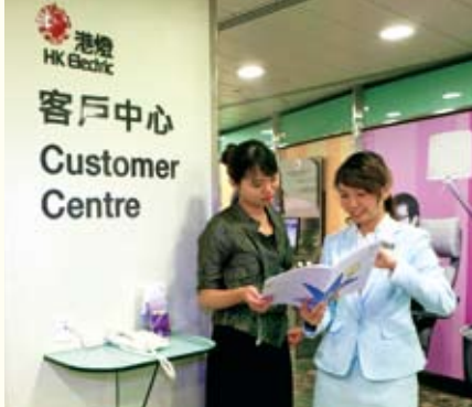
港燈僱員表現卓越，在亞太傑出顧客關係服務獎中囊括五個獎項。