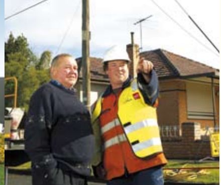
CitiPower 及 Powercor 客戶人數達一百萬。