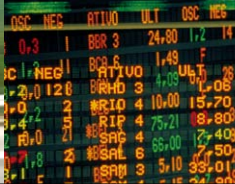
公司股東受惠於集團穩健的財務狀況。