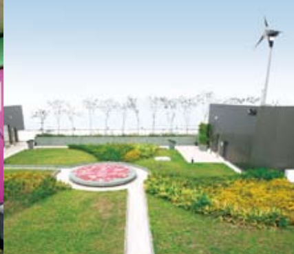
整個馬師道電站採用了全方位可持續發展概念設計。