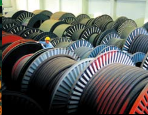
港燈維持高度可靠的電力供應。