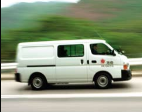
公司達標或超標完成二零零八年承諾的客戶服務標準。