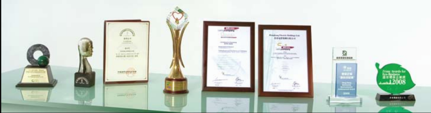
香港工商業獎2008；第八屆中國最佳公共關係案例大賽；香港保險業聯會職安健大獎金獎；香港第三齡學苑計劃獲頒傑出合作伙伴計劃獎；商界展關懷標誌；香港企業環保成就獎2008；盛世環保企業獎2008。