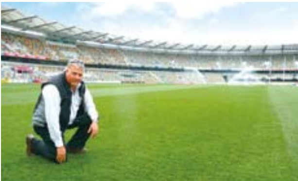
長江生命科技擁有澳洲最大之草地保育用品及服務供應商。

透過上述企業，長江生命科技擁有澳洲最大之草地保育用品及服務供應商，以及澳洲第二大之家居園藝產品供應商。