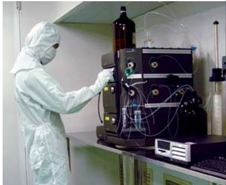
此痛楚舒緩產品已於加拿大展開第三階段臨床試驗，目前進展理想。

現被發展成一項專為經歷中度至嚴重痛楚的癌症病人而設之產品。TTX 的優點在於不帶鴉片特性及不會產生依賴性，效力持久，而且迅速見效。將來 TTX 會被研究用於舒緩其他方面之痛症。