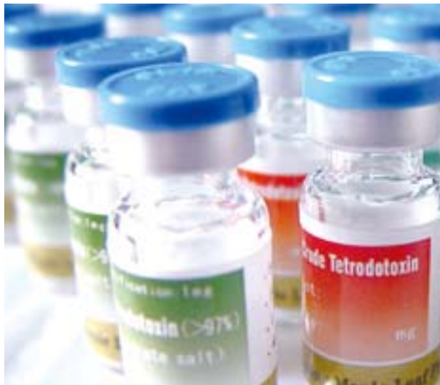
WEX Pharma 的舒緩痛楚技術平台建基於河豚毒素，是一種於河豚魚身上提取的天然化合物。

WEX 的技術平台建基於河豚毒素 (Tetrodotoxin 「TTX」)。TTX 乃阻礙鈉離子傳遞通道的天然化合物，主要從河豚魚身上提取，WEX 用其作為發展痛楚舒緩之研究。據估計，約百分之七十至九十的晚期癌症病人經歷痛楚，而絕大部分病者對痛楚舒緩方面未感滿意。TTX