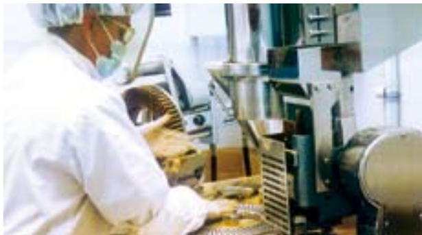
SNAG品牌旗下之所有產品均符合或高於加拿大衛生部規定的純度及濃度標準。

SNAG一直對維持最高產品品質標準非常重視。SNAG品牌旗下之所有產品均符合或高於加拿大衛生部規定的純度及濃度標準，而生產過程亦根據加拿大衛生部所指定的良好藥品生產規範(Good Manufacturing Practice「GMP」)之要求進行。透過對品質的承諾，SNAG為顧客提供安全及可靠的產品。