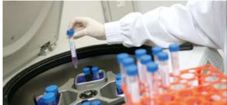
長江癌症研究院負責主理長江生命科技在香港有關癌症研發的項目，其中兩項有潛力之項目已展開了進一步的臨床前研究。

其他重點研究項目亦正在進行中，當中包括癌症免疫治療，以及從天然產品提取生物活性分子的研究。