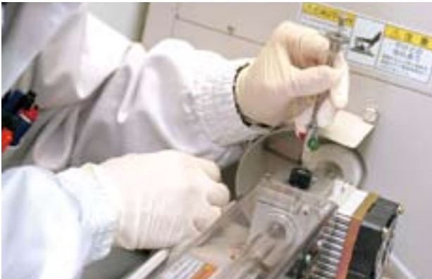
Polynoma 目前正研發一種治療黑色素瘤之疫苗。

於二零零八年九月，Polynoma 與美國食品及藥物管理局 (United States Food and Drug Administration 「FDA」) 舉行了新藥臨床前 (Pre-Investigational New Drug 「Pre-IND」) 會議。會議前，Polynoma 已向 FDA 提交所需的文件，其中包括第三階段臨床試驗計劃及向 FDA 諮詢有關藥物審批法規方面的意見。會議中，FDA 就進行第三階段臨床試驗前之新藥臨床 (Investigational New Drug 「IND」) 申請提供了不少指引及建議，這有助 Polynoma 展開第三階段臨床試驗的工作。