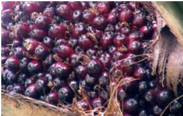
綠先機的肥料方案專為水果、蔬菜、廣闊農地及其他特別作物而設。

綠先機乃中國肥料產品先驅，研發、生產及銷售一系列針對減少環境污染的農耕用品。該公司所提供的產品系列能改善有機肥料的產量、質素及競爭力，有助農民加速採納，並減少使用傳統化學肥料。