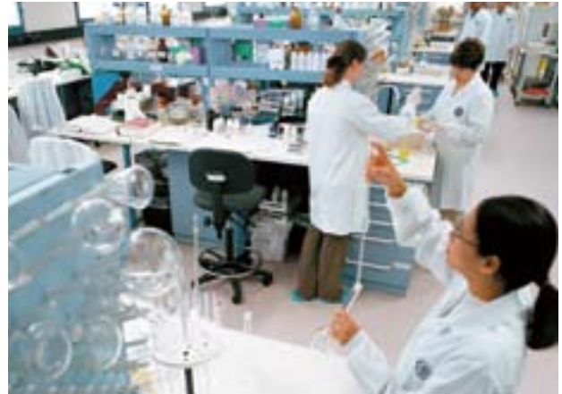
Lipa 專注擴展新產品開發業務，務求為現有產品線及服務增值。

年內，Lipa 專注擴展新產品開發業務，務求為現有產品及服務增值，及謀求更高的邊際利潤。Lipa 的新產品開發過程乃根據傳統活性成份的運用，配合臨床測試證