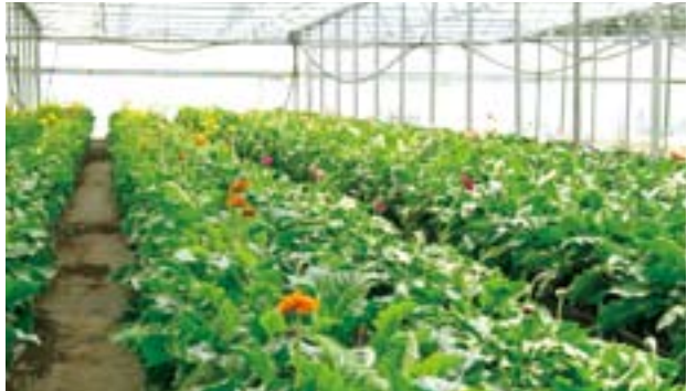
Ecofertiliser Group 於澳洲從事生產、分銷、銷售及技術支援服務。

Ecofertiliser 的業務覆蓋新南威爾斯、昆士蘭、南澳洲、維多利亞及西澳洲省，於全國各地從事生產、分銷、銷售及技術支援服務。其肥料分銷網絡覆蓋澳洲全國，而肥料生產設施則設於南澳洲、新南威爾斯及昆士蘭省。