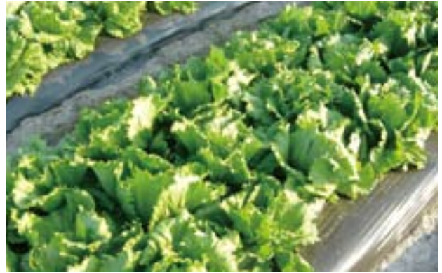
綠先機的肥料產品能改善有機肥料的產量、質素及競爭力，有助農民加速採納，並減少使用傳統化學肥料。

綠先機為不同的農作物提供不同的肥料方案。這些對特定作物的肥料方案皆以 NutriSmart 及 NutriWiz 為品牌，產品包括專門針對水果、蔬菜、廣闊農地及其他特別作物的肥料。這些作物為本的肥料產品，較市場上的傳統產品功效更顯著。透過與中國水稻研究所合作，綠先機已成功打入稻米市場，並獲該研究所確認其能大幅減少使用化學品的功能。