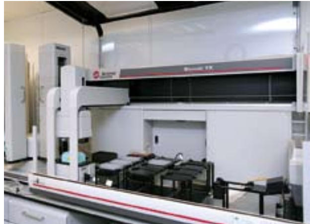
去年，Polynoma 與美國食品及藥物管理局舉行了新藥臨床前會議，有助該公司展開第三階段臨床試驗的工作。

由於發展路向清晰，新藥臨床申請之工作已加速進行。屆時，POL-103A 疫苗大可成為近年首隻香港上市公司獲美國 FDA 批准進入第三階段臨床試驗的藥物。