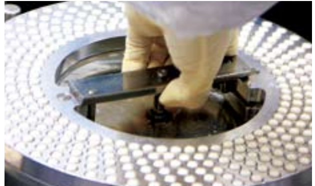
生產過程根據加拿大衛生部所指定的良好藥品生產規範之要求進行。

展望未來，SNAG計劃推出更多天然保健產品，以舒緩各種病況和病徵，以及作保健用途。SNAG亦提供一系列全新的循證天然保健產品，以針對特殊健康狀況作保健、預防或治療之用，此計劃將為顧客提供更多健康護理的選擇。