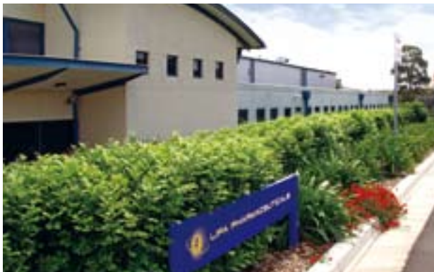
Lipa 是一家具領導地位的保健藥品承造商。

Lipa 於悉尼西部擁有設備先進的廠房，聘用超過三百五十名員工。廠房配備最高級別的生產設施及技術，可生產軟膠囊、片劑、膠囊、粉末、水劑及乳液。Lipa 一直執行嚴格的品質保證程序，符合澳洲醫藥產品的良好藥品生產規範(Good Manufacturing Practice「GMP」)要求。