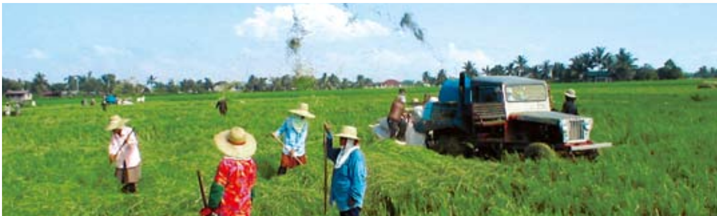
綠先機乃中國肥料產品先驅，專責研發、生產及銷售一系列環保農耕用品。

綠先機現與內地多個主要經銷商及大型個體農業企業合作，其營銷網絡已擴展至所有主要農業省份，包括廣東、廣西、江蘇、安徽、浙江及山東省。綠先機之業務於年內錄得可觀的銷售增長。