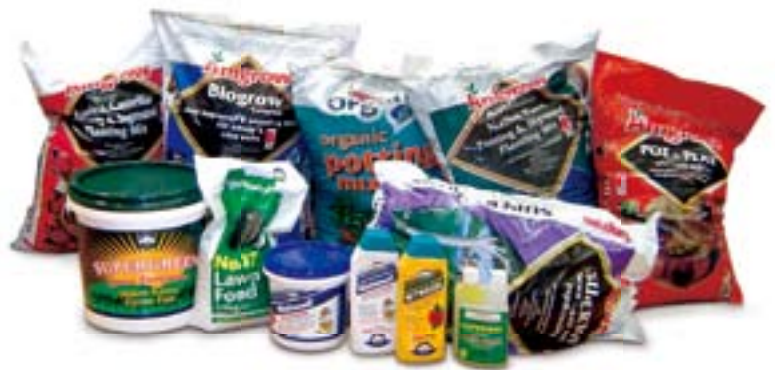
長江生命科技是澳洲第二大之家居園藝產品供應商。

年內，Ecofertiliser 表現強勁。該組織能在傳統肥料以外提供更安全、更健康及更環保的選擇，而乾旱暫緩的情況亦令近年的農業生產得以復甦；市場對肥料需求持續，為 Ecofertiliser 的業務帶來重大貢獻。