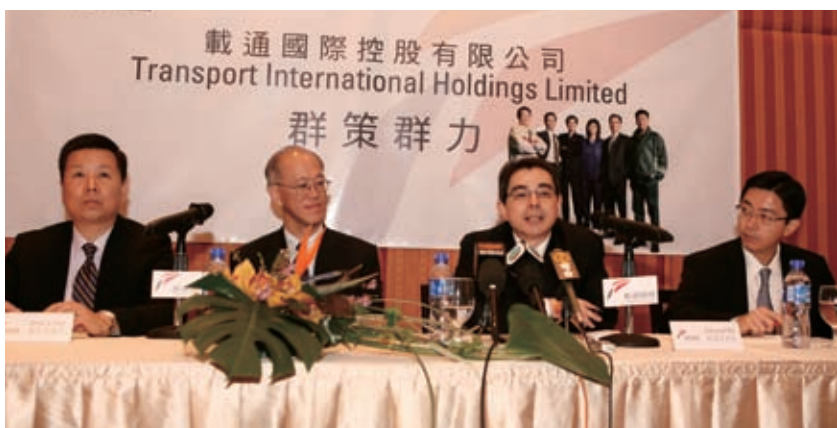
高級管理人員於2008年股東週年大會後舉行記者會

有關2008年股東週年大會會議的詳情及投票結果已於2008年5月29日刊載於本公司及聯交所的網站內。