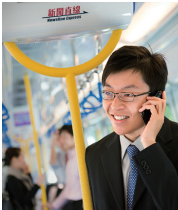
第三代流動電話服務現已覆蓋東鐵綫及馬鞍山綫。