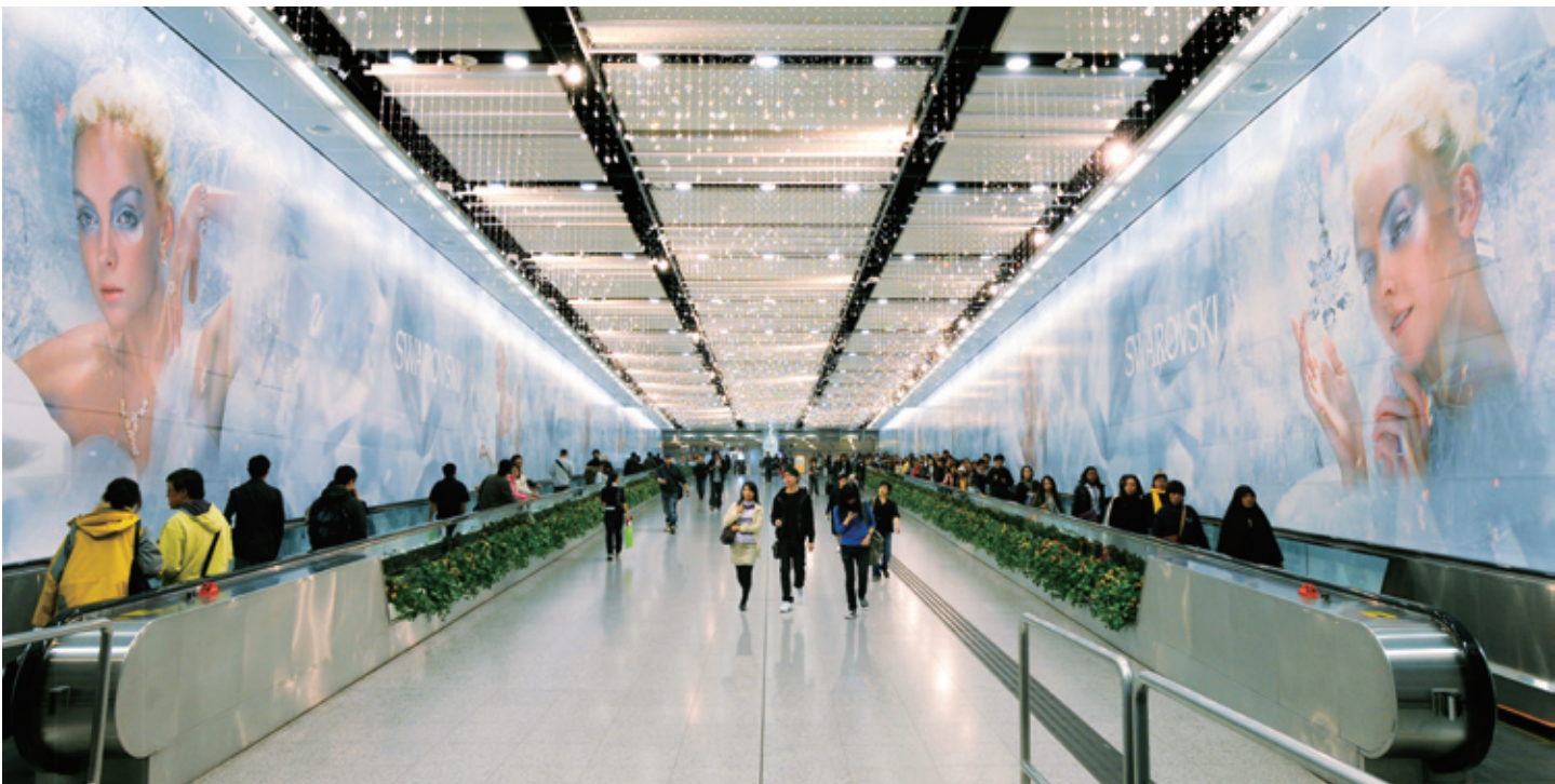
港鐵寬敞的轉綫處是發揮創意的理想廣告點。

年內，公司現有的顧問項目取得進展，並簽訂了各項新合約，以配合透過顧問服務來提升技術和尋求新投資機會的重點策略。於2008年，對外顧問服務的收入為1.58億港元，