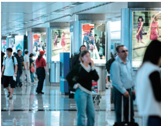
兩鐵合併後，港鐵車站的廣告點增至20,539個。

車站零售設施於2008年的收入(包括免稅店和車站商店租金)增加209.8%至15.46億港元(與對等的合計非車費收入相比則增加42.3%)。這項收入增加，主要來自新增的九鐵綫沿綫零售商店，尤其是10間服務過境旅客的免稅店。其餘增長來自新增的零售設施面積及上調的新訂合約租金。為了令顧客更感滿意和增加公司收入，於9個車站共有45間商店完成翻新，另外新增了18個商品類別。年內，我們收回部分商店進行翻新，截至2008年12月31日止的商店總數達1,186間，較2007年底的1,230間略為減少，而零售設施的總面積為51,539平方米，其中9,510平方米與免稅店業務有關。公司在年底前完成翻新牛頭角、黃大仙、大埔墟、九龍、調景嶺、九龍塘、觀塘、旺角東站以及羅湖抵港大堂的商店。