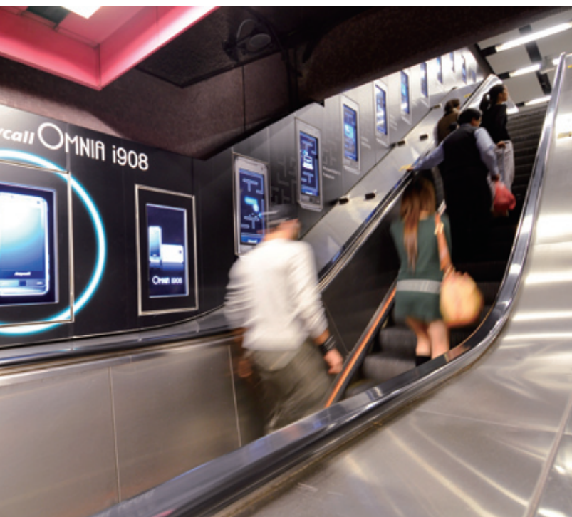
港鐵的新猷包括開創亞洲鐵路網絡先河的「數碼扶手電梯廣告屏幕」。