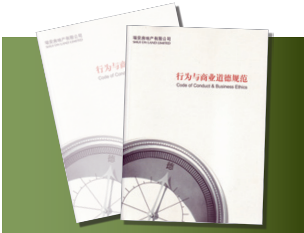
瑞安上下員工均恪守《行為與商業道德規範》中所列的原則及指引