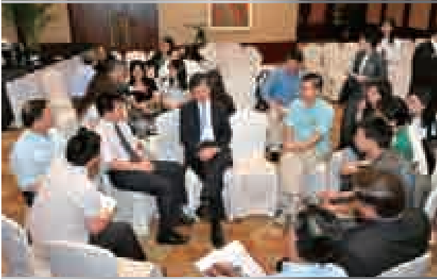
公司於股東周年大會結束後首次舉行「集團管理層與股東座談時段」，讓管理層成員與股東溝通交流