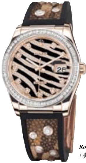
Rolex 'Royal Pink' watch. 「勞力士」的「Royal Pink」腕錶。