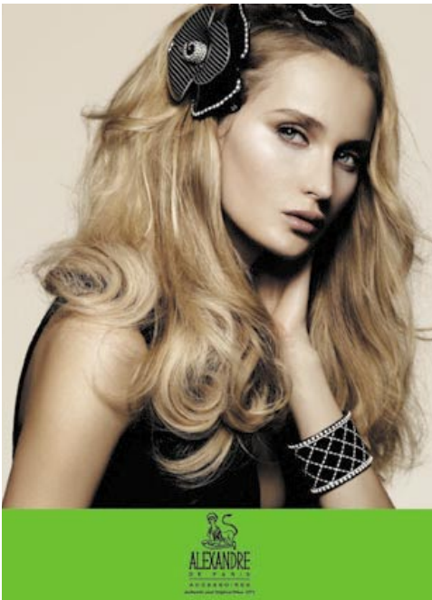
Luxury hair accessories by Alexandre de Paris. 「Alexandre de Paris」名貴髮飾。

於二零零九年二月，本集團宣佈其獲授權銷售、製造及進口若干「Polo」及「Ralph Lauren」商標之獲授權商品之期限已獲延續一年至二零零九年十二月三十一日。Polo Ralph Lauren Corporation將於該授權屆滿時繳付予本集團18.2百萬美元。