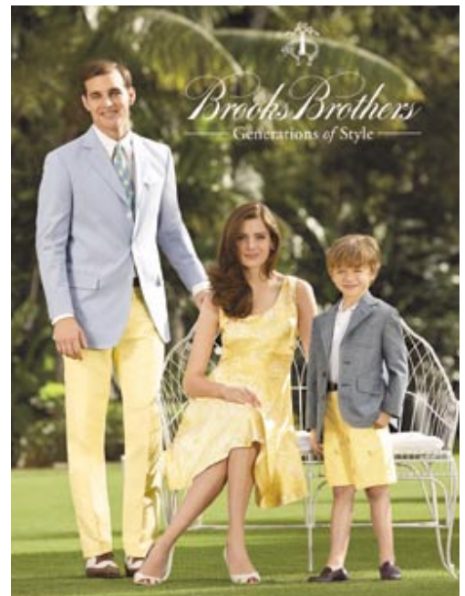
Fashionwear by Brooks Brothers. 「Brooks Brothers」時裝。