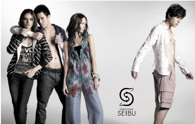
Spring/Summer 2009 fashion at Hong Kong Seibu. 於「香港西武」的二零零九年春/夏季時裝。