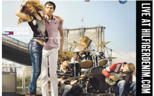
Hilfiger Demin fashionwear. 「Hilfiger Demin」時裝。

在地理上，香港佔銷售額百分之五十五、中國佔百分之二十、台灣佔百分之十六，以及其他東南亞地區佔百分之九。