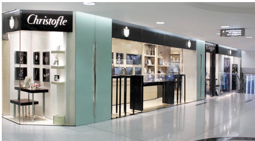
Christofle boutique at Prince's Building, Central, Hong Kong.