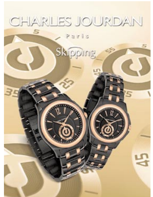
Charles Jourdan 'Skipping' watches. 「卓丹」的「Skipping」腕錶。

全球經濟危機對環球營商環境已構成前所未有之負面影響。此外，全球經濟何時得以復甦仍然不明朗，以及現時環球爆發H1N1甲型流感對國際旅遊業及顧客之消費意欲亦帶來負面之影響。由於該等不明朗之因素，本集團將對進一步發展及擴充其業務採取審慎態度。