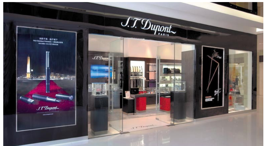
S.T. Dupont boutique at Paragon Center, Xiamen, China. 位於中國廈門市磐基國際名品中心的「都彭」精品店。