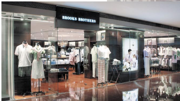
Brooks Brothers boutique at Festival Walk, Kowloon Tong, Hong Kong.