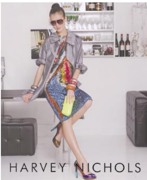
Ladies fashion at Harvey Nichols. 於「夏菲尼高」的女士時裝。