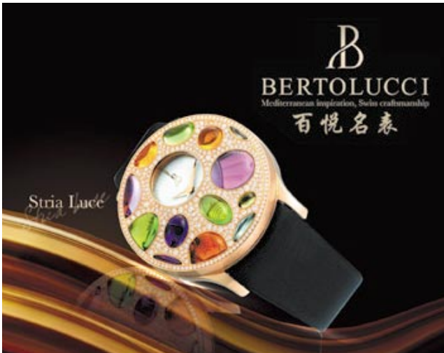
Bertolucci 'Stria Luce' watch. 「百悅名表」的「Stria Luce」腕錶。

然而，本集團將繼續藉投資新代理項目，以及在亞洲各地當有合適主要地點及吸引的條件時開設新店鋪，以顯示其在零售業致力發展之決心。此舉將令本集團長遠而言提升其股東所持股份之價值，並展示予各品牌授權人本集團在任何時間及任何情況下仍能發展並提升旗下品牌之潛能。