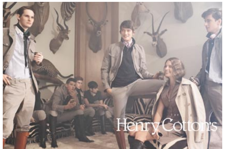
Mens and ladies fashion by Henry Cotton's. 「Henry Cotton's」男士及女士時裝。