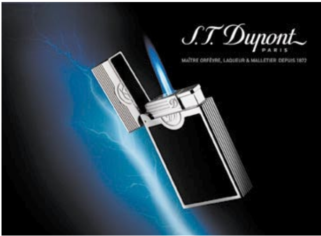
S.T. Dupont 'Ligne 2 Liberté' lighter. 「都彭」的「Ligne 2 Liberté」打火機。