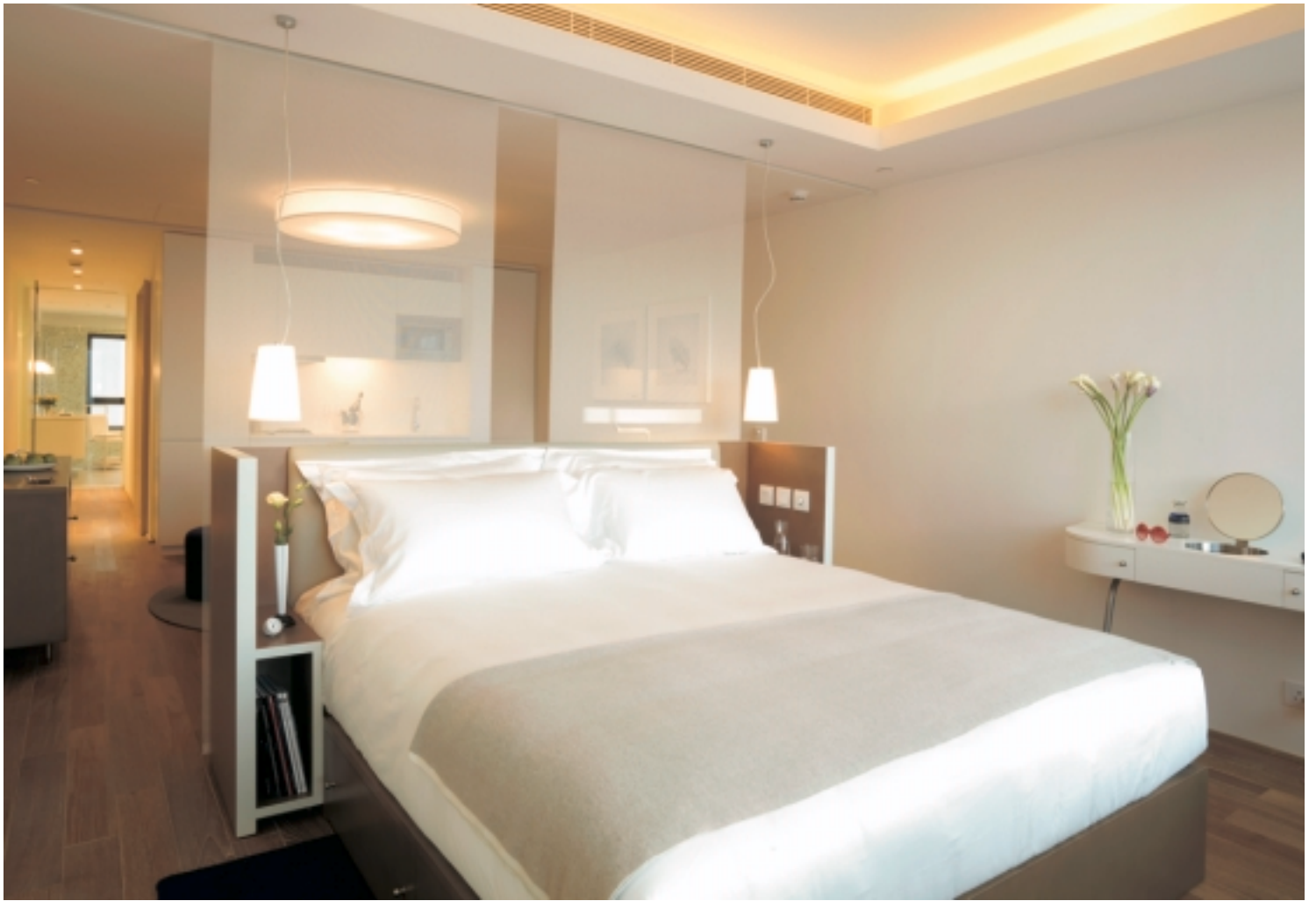
The interiors of 138 Connaught Road West offer a luxurious living environment. 干諾道西 138 號時尚酒店項目室內設計尊貴典雅，為住客提供舒適之生活環境。