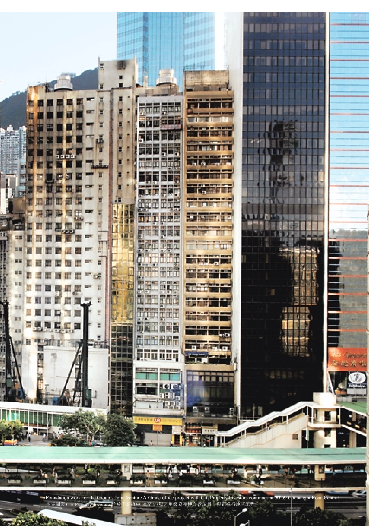
Foundation work for the Group's Joint Venture A-Grade office project with Citi Property Investors continues at 50-59 Connaught Road Central. 本集團與 Citi Property Investors 位於干諾道中 50 至 59 號之甲級寫字樓合營項目，現正進行地基工程。