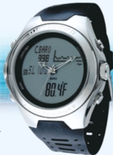
行針跳字登山手錶，配備指南針、氣壓計、測高儀、數據記錄功能及滑雪用計時器。

於回顧年度內，本集團因完成出售其位於加拿大多倫多之「St. Thomas壹號府第」項目約百分之九十之住宅公寓單位之交易，故銷售收益大幅上升，成績令人滿意。