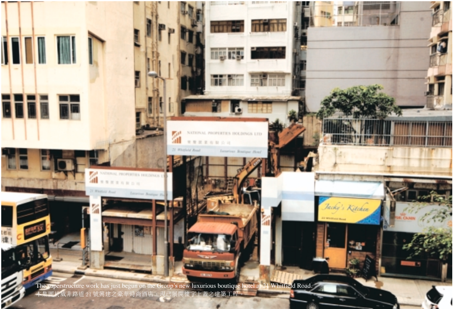
The superstructure work has just begun on the Group's new luxurious boutique hotel at 21 Whittfield Road. 本集團於威非路道 21 號興建之豪華時尚酒店，現已展開樓宇上蓋之建築工程。