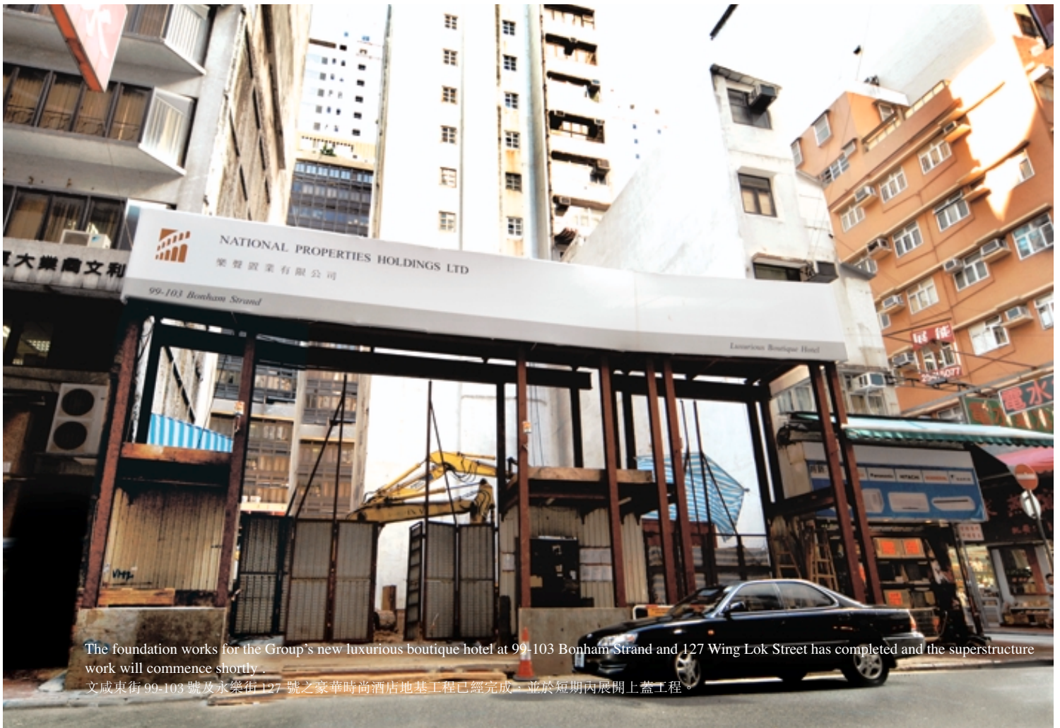
The foundation works for the Group's new luxurious boutique hotel at 99-103 Bonham Strand and 127 Wing Lok Street has completed and the superstructure work will commence shortly. 文咸東街 99-103 號及永樂街 127 號之豪華時尚酒店地基工程已經完成，並於短期內展開上蓋工程。