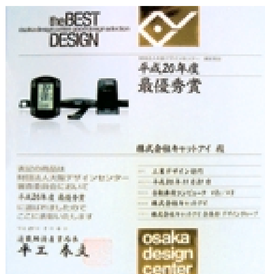
本集團之產品於國際知名之「大阪設計中心」榮獲最佳設計獎。

一如去年，本集團擁有合理水平之現金資源及備用信貸額，提供足夠之流動資金以應付其承擔及營運資金需要。