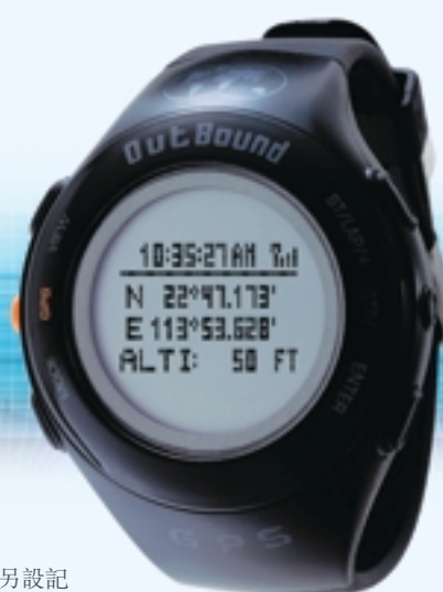
全球衛星定位手錶，內置指南針，能追蹤位置及海拔高度，另設記憶體儲存多達 10 條路徑資料，並將資料以電子地圖形式顯示。

本集團與Citi Property Investors位於香港中環干諾道中50至59號之甲級寫字樓樓宇合營發展項目之地基工程亦正在進行。該項目預期於二零一一年初落成。