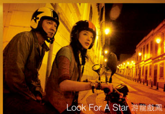
Look For A Star 游龍戲鳳