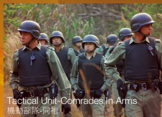
Tactical Unit - Comrades In Arms 機動部隊-同袍