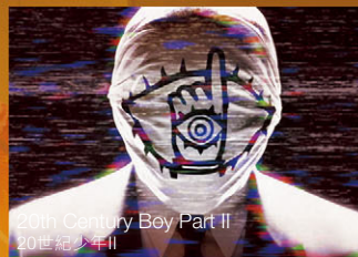
20th Century Boy Part II 20世紀少年II