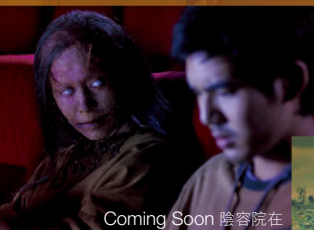
Coming Soon 陰容院在