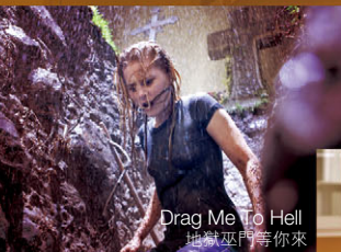
Drag Me to Hell 地獄巫門等你來