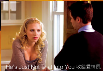
He's Just Not That Into You 收錯愛情風