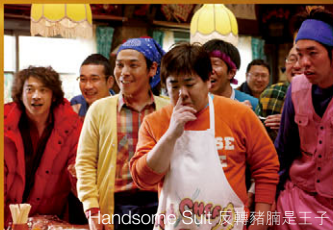
Handsome Suit 衣褲豬胸是王子