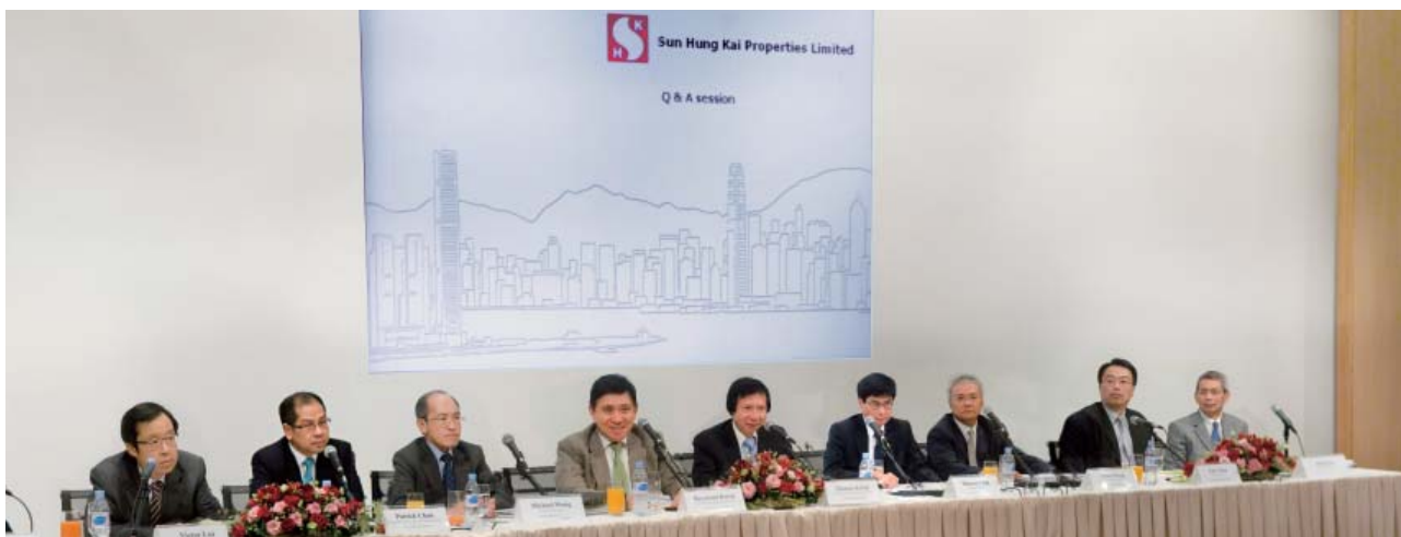
集團在公佈業績後舉行投資界簡報會，有效維持良好投資者關係。