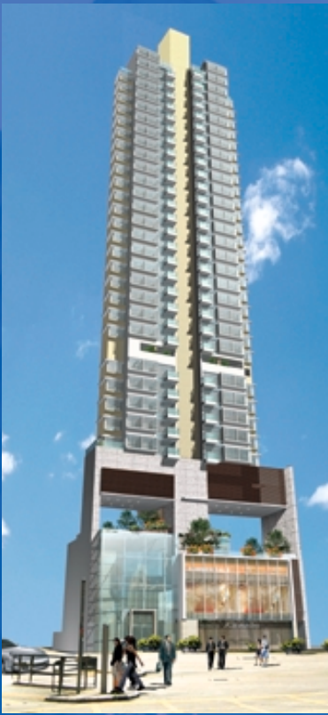
大埔道項目 (構想圖)