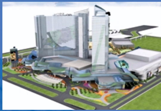
澳門星麗門 (構思圖)