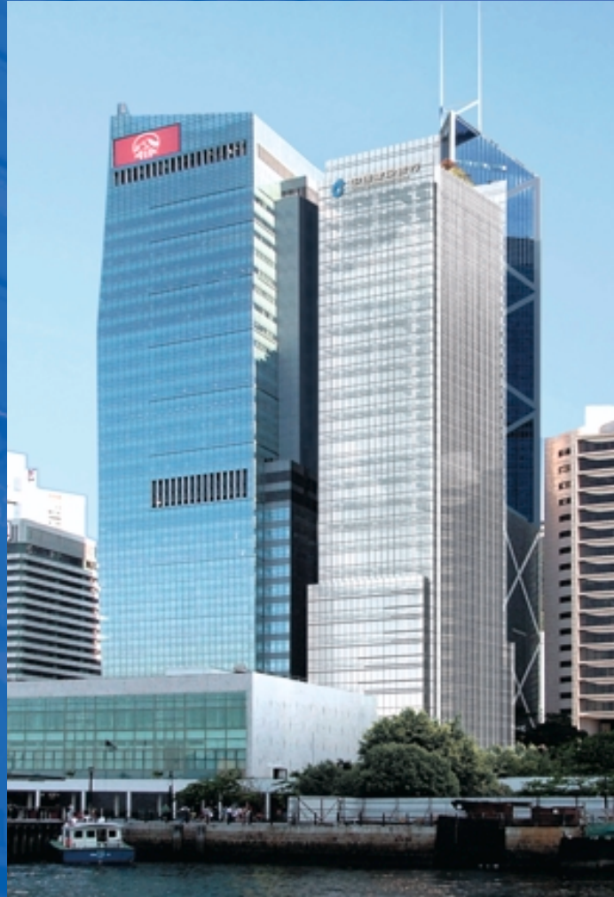
香港干諾道中3號 (構想圖)