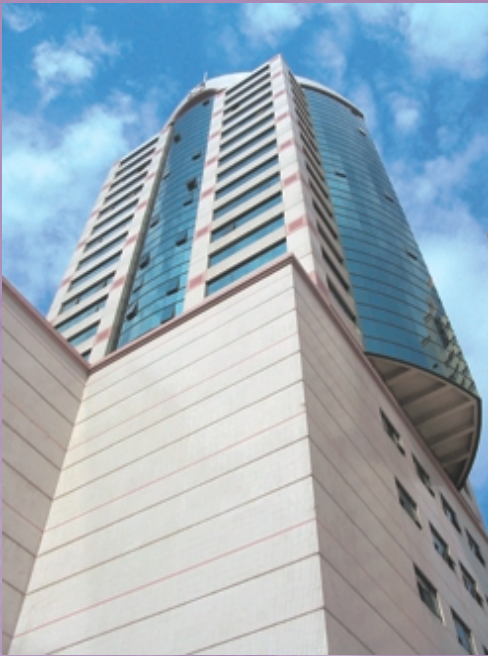
上海閘北廣場第一期