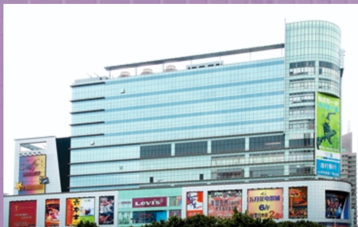
廣州五月花商業廣場