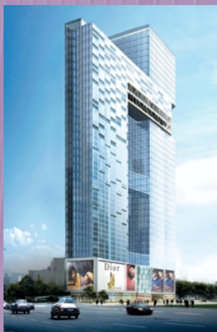
廣州海珠廣場 (構想圖)