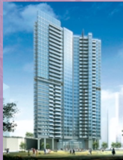
廣州東風廣場第五期一住宅大樓 (構想圖)