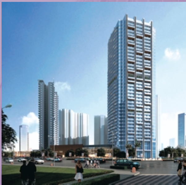
廣州東風廣場第五期一酒店式服務公寓 (構想圖)