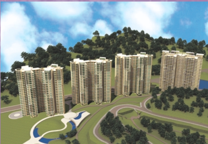
廣州金沙洲項目第一期 (構想圖)