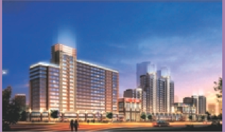
上海五月花生活廣場 (構想圖)