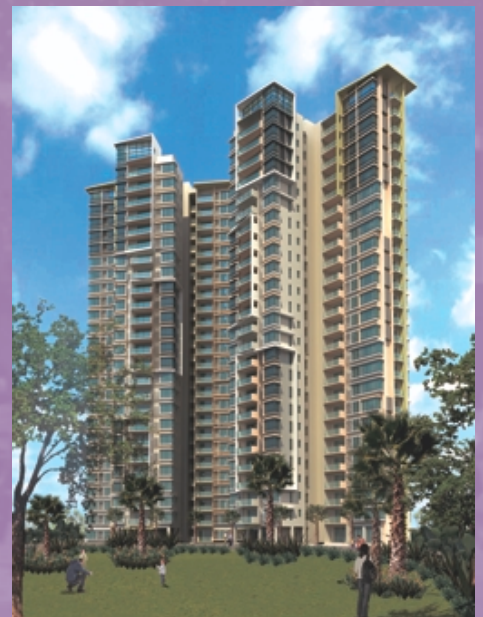
廣州金沙洲項目第一期 (構想圖)