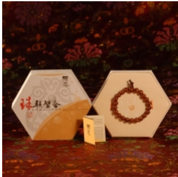
「珠聯璧合」組合禮盒