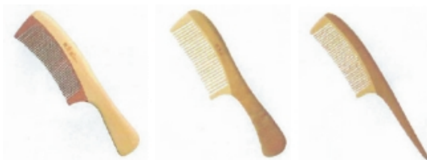
混合材料梳(結合多種木料)