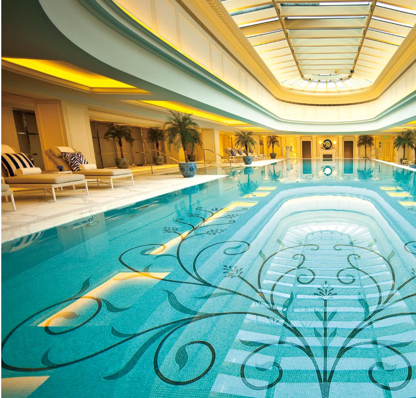
右圖：仿羅馬式的室內游泳池全長25米，以天窗照明。