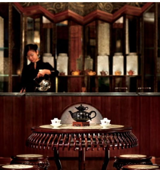
下圖：酒店中餐廳逸龍閣以傳統中國茗茶款客。

除客房及餐廳外，上海半島酒店具備各種設施以迎合不同賓客的需要，例如玫瑰廳及5個活動場地、展出1930年代中國首架水上飛機仿製品的樂士文廳、半島水療中心、室內恆溫游泳池、駐有25家國際高級品牌店鋪的半島酒店商場，以及勞斯萊斯及寶馬轎車車隊。