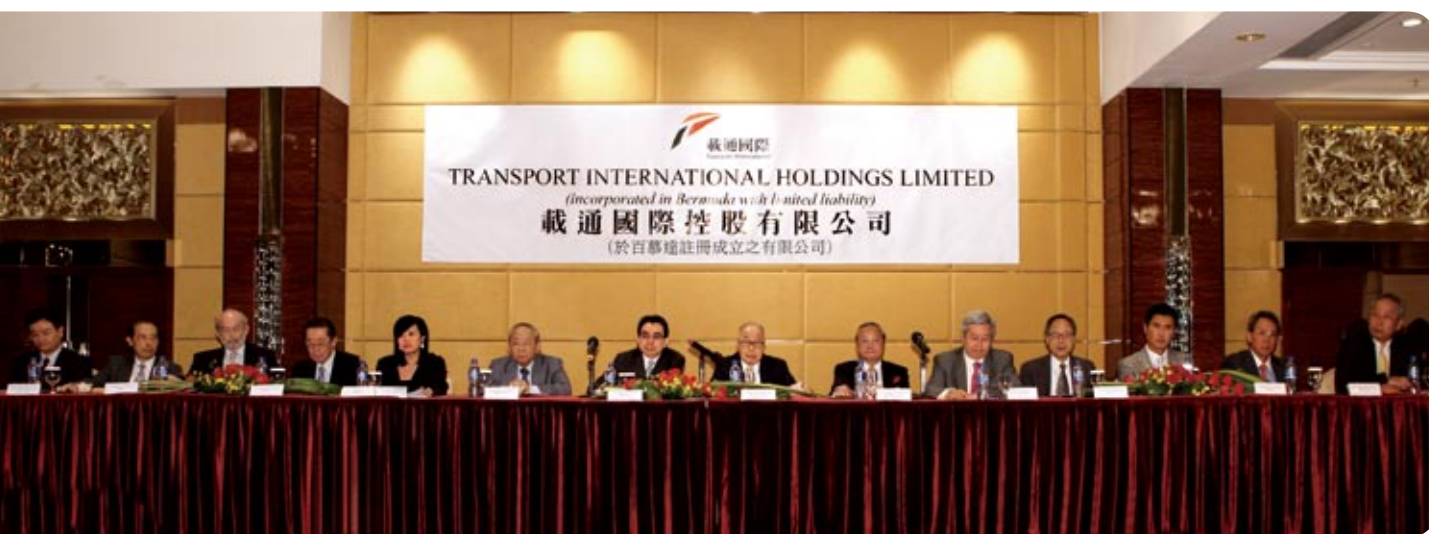
眾董事於2009年股東週年大會上會見股東

董事會視股東大會為與股東直接溝通的重要良機。全體董事及高級管理人員通常都會出席股東週年大會及其他股東大會。股東會被邀請於這些會議上向董事提問，或透過本公司的電郵地址director@tih.hk向董事作出查詢。有關查詢會第一時間由本公司的公司秘書處理。