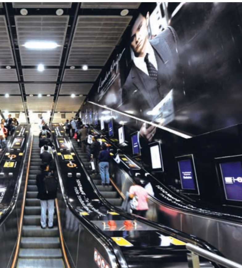
數碼扶手電梯廣告屏幕，令宣傳的產品更加鮮明奪目。