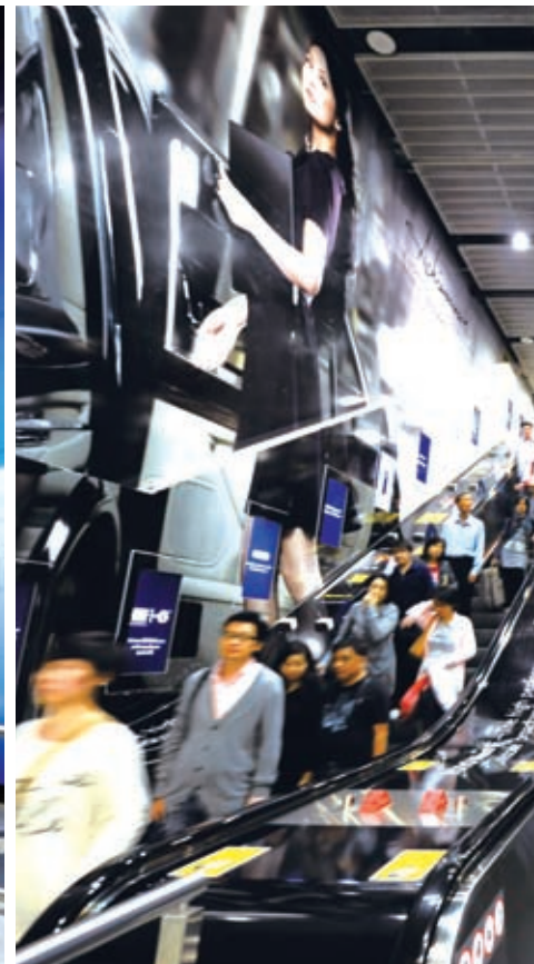
香港站的轉綫通道提供廣泛的廣告宣傳機會。

此外，公司已在東鐵綫及西鐵綫展開廣告牌的更換及位置重整計劃，並將於2010年完成。截至2009年年底，我們共有20,742個車站廣告點、26,823個車廂廣告點(包括4,545個液晶顯示屏)，並於42個車站設有67個展覽及陳列場地。