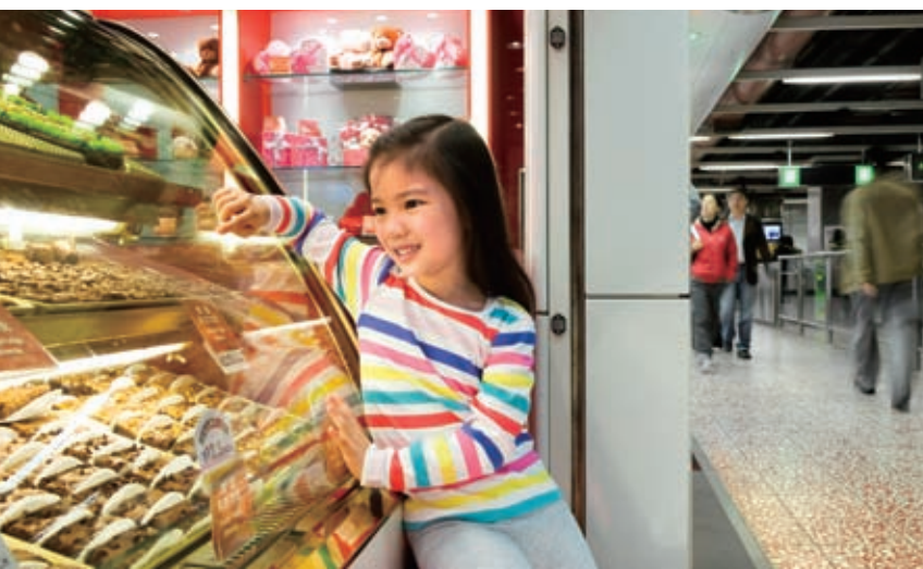
港鐵車站商店為乘客提供各式各樣的產品和服務。