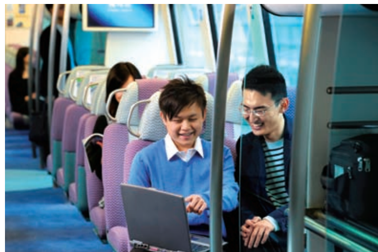
Wi-Fi服務現已覆蓋機場快綫全綫列車。