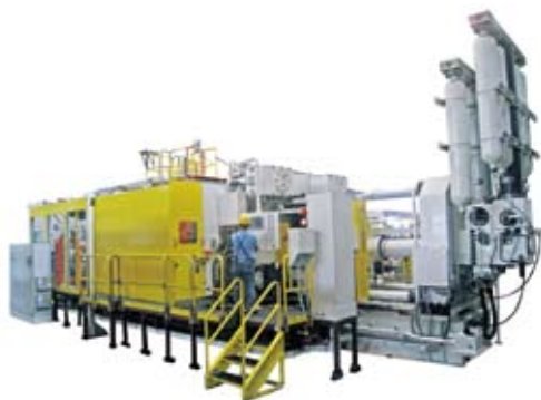
本集團供給美國某知名客戶的3000噸大型冷室壓鑄機

受金融危機影響，本年度上半年客戶對大型壓鑄設備的新增採購陷於停滯且原有訂單交付遭遇延遲，僅有小型壓鑄設備逆市增長。但本年度下半年原來延遲交付的訂單紛紛恢復交付，不僅如此，新增訂單加速增長，尤其在中國，壓鑄機市場增長勢頭令人鼓舞，本集團本年度壓鑄機產品來自中國市場的營業額比去年同期增長幅度超過65%。