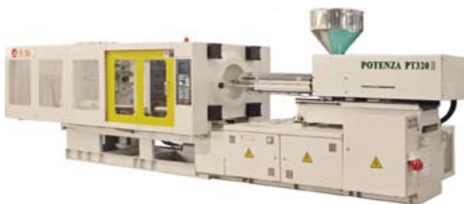
本集團320噸的伺服節能注塑機

本年度本集團在注塑機研發方面取得了成果。在伺服節能注塑機方面，經國家塑膠機械產品品質監督檢驗中心權威檢測，本集團研發的伺服節能精密注塑機達到了國家一級節能標準，並在行業內處於領先水平。在成功推出「Effort」系列直壓式注塑機的基礎上，本集團已經研發出性能更加優越的第二代直壓式注塑機，並開始推出市場。在大型注塑機方面，本集團成功研發出「FORZA」新系列大型二板式注塑機，同時已經研發出鎖模力為3000噸的大型注塑機，這不僅是本集團在研發上的一項重要突破，還為擴大本集團的注塑機產品線、滿足客戶需求和加快本集團注塑機業務的發展起到關鍵作用。