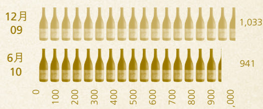
現金及現金等價項目及定期存款 百萬港元