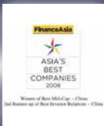
被Finance Asia 評為 — 2008最佳中型企業(中國組) — 2008最佳投資者關係第三位(中國組)