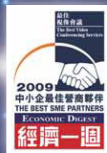
2009中小企最佳營商 夥伴獎— 最佳視像會議獎