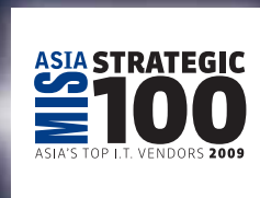
2009區域首20位之 信息通信技術公司