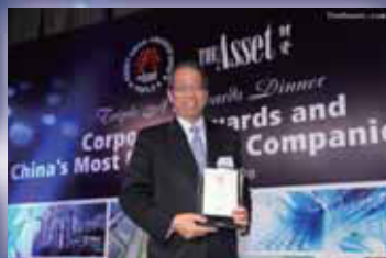
2009 The Asset Corporate 頒獎典禮