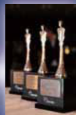
連續7年榮獲傑出推銷員 獎及傑出青年推銷員獎