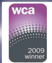
世界通信獎(WCA) 2009之 「最佳管理服務」