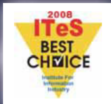
2008 ITes Best Choice 獎項