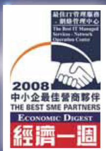
2008中小企最佳營商 夥伴獎—最佳IT管理 服務—網絡管理中心