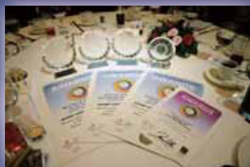
連續3年榮獲亞太顧客 關係服務獎