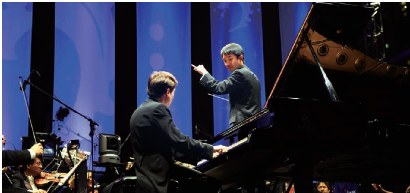
由香港管弦樂團主辦的太古「港樂 • 星夜 • 交響曲」。