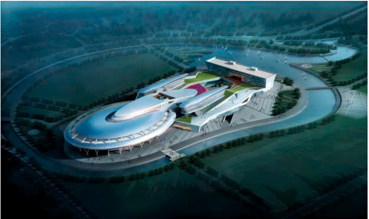
人工設計圖片(需再行修改)

截至二零一零年十二月三十一日，本集團就發展該項目作出資本承擔約人民幣187,700,000元，其中本集團已清付約人民幣38,600,000元。截至本報告日期，除本公司於二零一零年五月十九日的通函及二零一零年十月二十五日的公佈所載收購該物業及已擁有土地外，本集團並無購入位於該物業及已擁有土地毗連地區的任何土地。然而，本集團擬於日後進一步收購土地，及於該物業、已擁有土地及於新購入土地(如有)之上進行建築工程，落實本集團對該項目的參與。